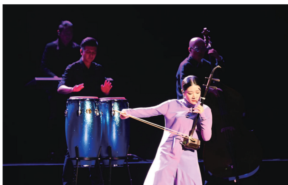
上海民族乐团原创的国乐与AI音乐会《零·壹|中国色》日前在凯迪拉克·上海音乐厅上演。