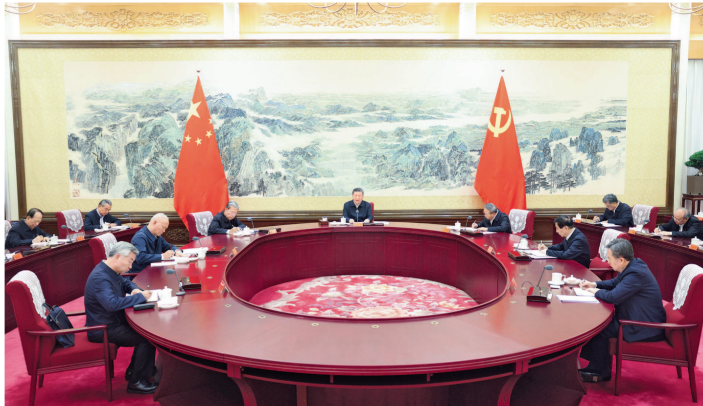
12月26日至27日，中共中央政治局召开民主生活会，中共中央总书记习近平主持会议并发表重要讲话。