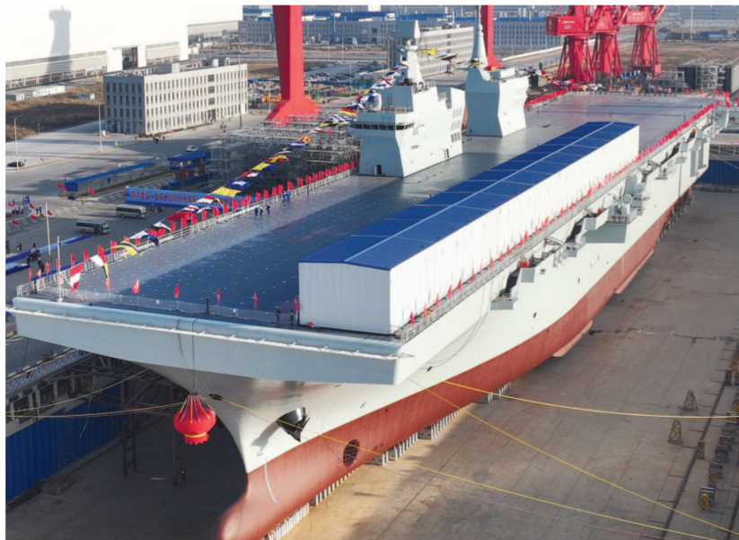
12月27日上午，我国自主研制建造的076两栖攻击舰首舰下水命名仪式在上海举行。

新华社上海12月27日电 (记者黎云)12月27日上午，我国自主研制建造的076两栖攻击舰首舰下水命名仪式在上海举行。 经中央军委批准，076两栖攻击舰首舰命名为“中国人民解放军海军四川舰”，舷号为“51”。四川舰满载排水量4万余吨，设置双舰岛上层建筑 and 全纵通飞行甲板，创新应用了电磁弹射和阻拦技术，可搭载固定翼飞机、直升机、两栖装备等，是海军新一代两栖攻击舰，是推进海军转型建设发展、提升远海作战能力的关键装备。▼ 下转第四版