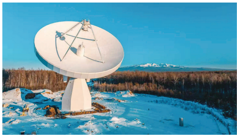
长白山40米射电望远镜。

随着日喀则、长白山40米射电望远镜落成启用，我国甚长基线干涉测量(VLBI)网将完成从“四站一中心”到“六站一中心”的升级，首次具备“双子网、双目标”的探测能力。▶ 刊第三版