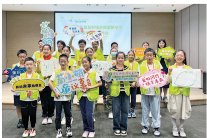
▲“打造100个儿童友好城市阅读新空间”被列为今年上海为民办实事项目。

《条例》出台，是图书馆事业发展从政策指引走向法治保障的必由之路。上海是我国图书馆事业发源地，也是最早开展图书馆制度建设的地区之一。早在1987年9月，《上海市区图书馆管理办法》就经上海市人民政府批准发布。1996年11月，在原管理办法基础上迭代出台了覆盖面更广、内容更完整的《上海市公共图书馆管理办法》，提出了很多新理念、新举措。如明确规定“市和区（县）图书馆应当每天（包括节假日）向读者开放”，这是全国首次以制度方式要求图书馆“三百六十五天，天天开放”；再如规定“对图书、报刊借阅实行免费服务”“不得另立标准，限定图书资料的公开借阅范围”，掀开了图书馆免费开放的序幕。其他诸如“专业治馆”“社会参与”等方面的规定，在现今图书馆领域仍然具有重要的示范价值。然而，只落实到政府部门规章制度层级，未上升到地方条例层面，无论是政府保障力度、还是法治规制力度，都有所欠缺。这些行之有