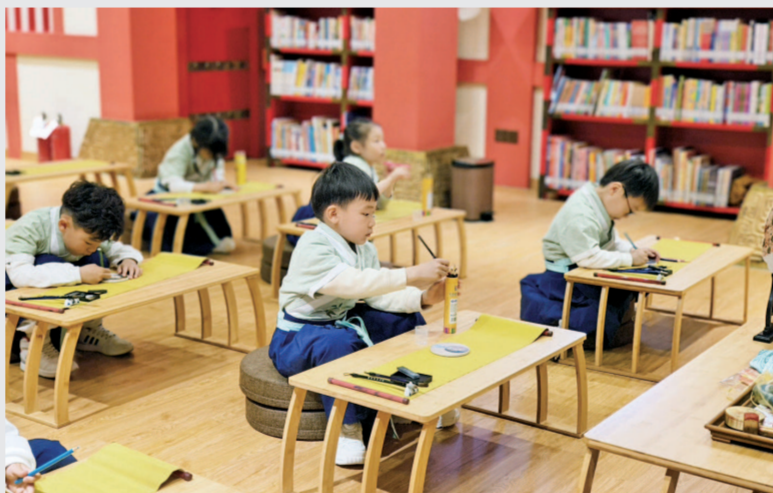
▲各级各类公共图书馆深入人民城市肌理。从上至下分别为：上海图书馆东馆、徐家汇书院、未央学馆。

明确要求公共图书馆应当加强数字化服务能力，向读者提供文献信息线上检索、查询、借阅和智能推介等服务。二是提升公共图书馆国际化服务水平。上海作为我国改革开放的前沿阵地和深度链接全球的国际大都市，围绕“深入推进国际文化大都市建设，加快提升文化软实力”的目标，《条例》提出设置外国文字标识指引，增加外文文献收藏，提供多语种咨询服务，提升多元文化服务水平。三是发挥公共图书馆阅读推广主阵地作用。《条例》结合本市实际创新性地将全民阅读元素融入公共图书馆与其他机构合作开展阅读推广活动，结合馆藏特色、资源优势，形成各具特色的阅读推广活动品牌。