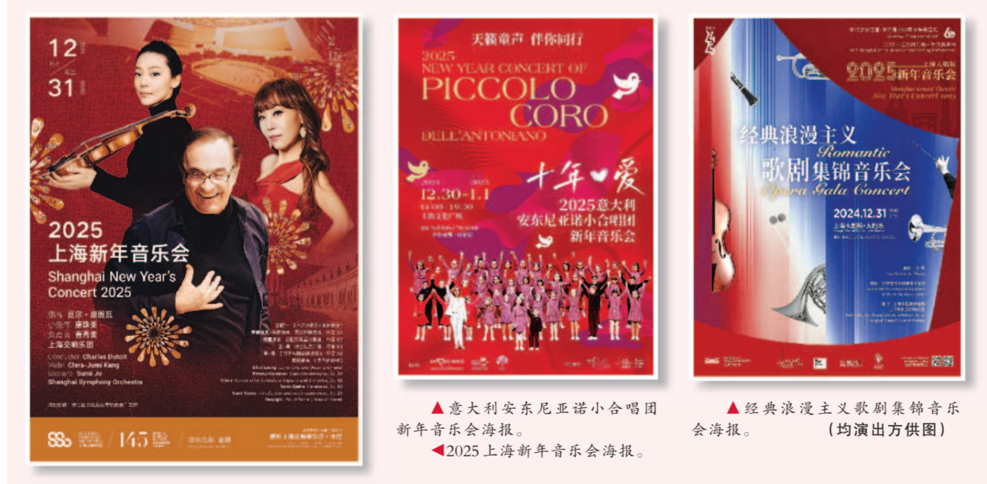
▲意大利安东尼亚诺小合唱团新年音乐会海报。 ▲2025上海新年音乐会海报。

作为上海文化的一张闪亮名片，上海新年音乐会每年都在上海交响乐团精心策划下，通过中西文明的对话向世界致以新年问候。