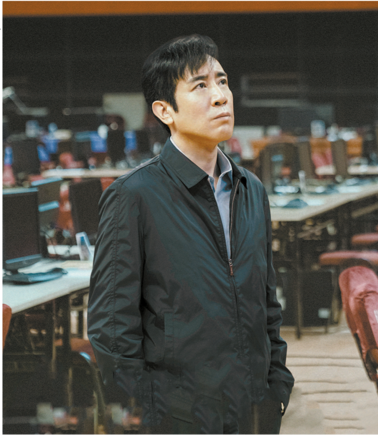
警察形象的塑造史其实就是中国法治的发展建设史，荧屏警察形象的变化也恰恰说明了法治建设的成效。从左图起逆时针分别为《我是刑警》中于和伟饰演的秦川，《营盘镇警事》中张嘉益饰演的范党育，《对决》中王景春饰演的文陆阳，《尘封十三载》中陈晓饰演的陆行知。

当然，随着公安剧井喷式地增长，也出现了不少同质化之作，观众会产生一定的审美疲劳。这就要求创作者在塑造警察形象时，不能是单一的而应是立体化的，在大量收集人物、案件原型的基础上，既要追求“传统”的一面，也要体现“现代”的一面，再加上与法治发展、普法教育相结合，相信未来的创作会更加多元，更能体现刑警精神。剧集在好看烧脑的同时，还能带领观众在沉浸式破案过程中积极参与到法治建设中来，潜移默化地开展了普法教育，也算是该类型剧的一大贡献。