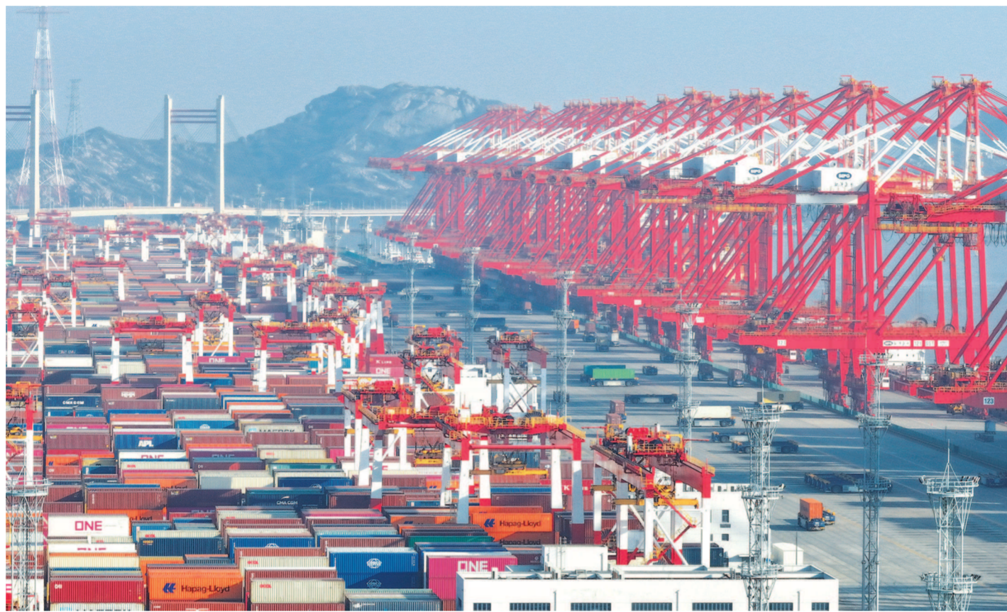
昨天,2024年上海港第5000万标准箱装卸完成。

与此同时,上海国际航运中心建设加快推进,不断锻长板、补短板,在全球航运业数字化、智能化、绿色化转型中抢占先机,在一些新领域实现对老牌国际航运中心的“换道超车”。