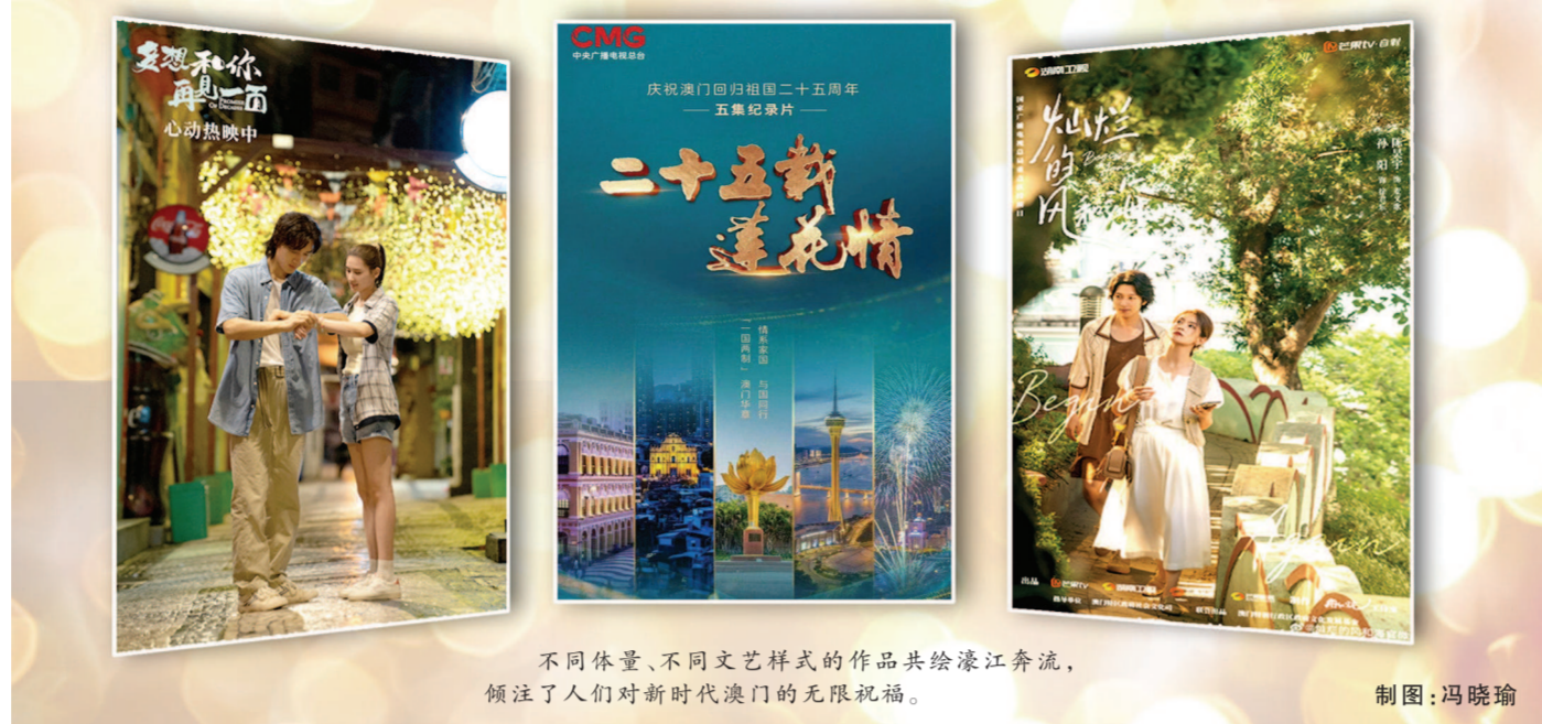
不同体量、不同文艺样式的作品共绘濠江奔流,倾注了人们对新时代澳门的无限祝福。

与宏观叙事互为补充,聚焦具体“人”的成长、“人”的获得感,成为许多纪实性节目的重点关注。25集微视频《情满濠江》走进澳门市民的日常生活,见证澳门回归祖国后发生的历史性变革,取得的历史性成就;25集纪录片《我与湾区共成长》通过系列人物讲述,反映25年来背靠祖国、粤澳携手的发展成就;专题片《回归的一代》深入挖掘当地青年人物故事,展现澳门与祖国的紧密纽带以及未来澳门发展的新契机。