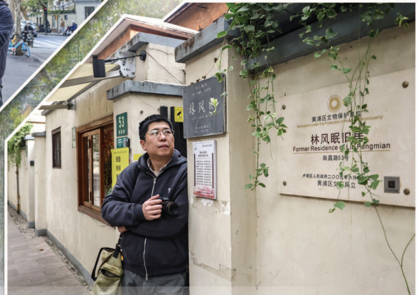
均本报记者 袁婧摄 制图:冯晓瑜