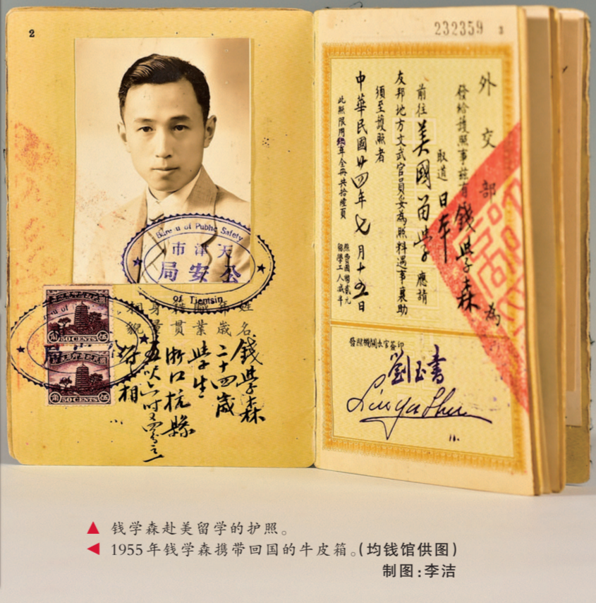
钱学森赴美留学的护照。1955年钱学森携带回国的牛皮箱。 制图:李洁