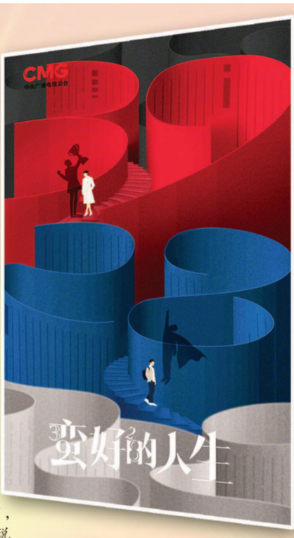
中央广播电视总台2025年电视剧片单发布,图为抗战大剧《八千里路云和月》,改编自同名小说的《千里江山图》、上海出品《蛮好的人生》海报。