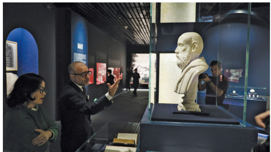
28家中意文博机构的200余件文物齐聚上海博物馆，共同呈现马可·波罗所处时代中国与世界的文明交往故事。