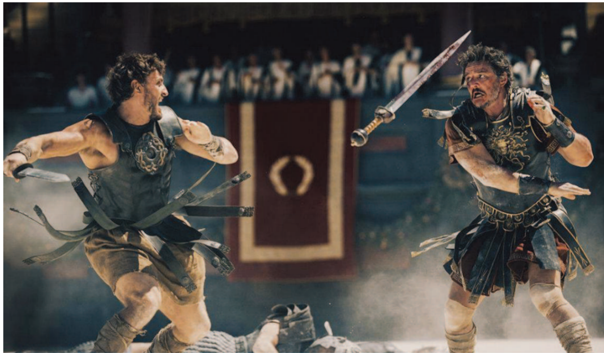
导演雷德利·斯科特时隔24年给《角斗士》拍的这部续集,尽管电影情节大同小异,都是关于一个丧失自由的男人在角斗场上伺机复仇的故事。但事实上,《角斗士2》的方方面面是对《角斗士》的颠覆和瓦解。

罗素·克劳因为《角斗士》得了奥斯卡最佳男主角奖后,他的名字成为特殊的“形容词”。在后一年的《欲望都市》剧集里,女朋友们讨论各自的“理想男人”——“罗素·克劳。”“女人在罗素·克劳面前能干啥?”“还是乔治·克鲁尼吧。”“哦,这家伙就像一套香奈儿套装!”克鲁尼代表了城市淑女认证的优雅和教化,以他为参照,克劳提供了“男性理想”的另一个极端:原始,野蛮,荷尔蒙。不仅戏里的马克西莫斯是言辞木讷的,生活中的克劳同样脾气暴躁,难于相处,真人和