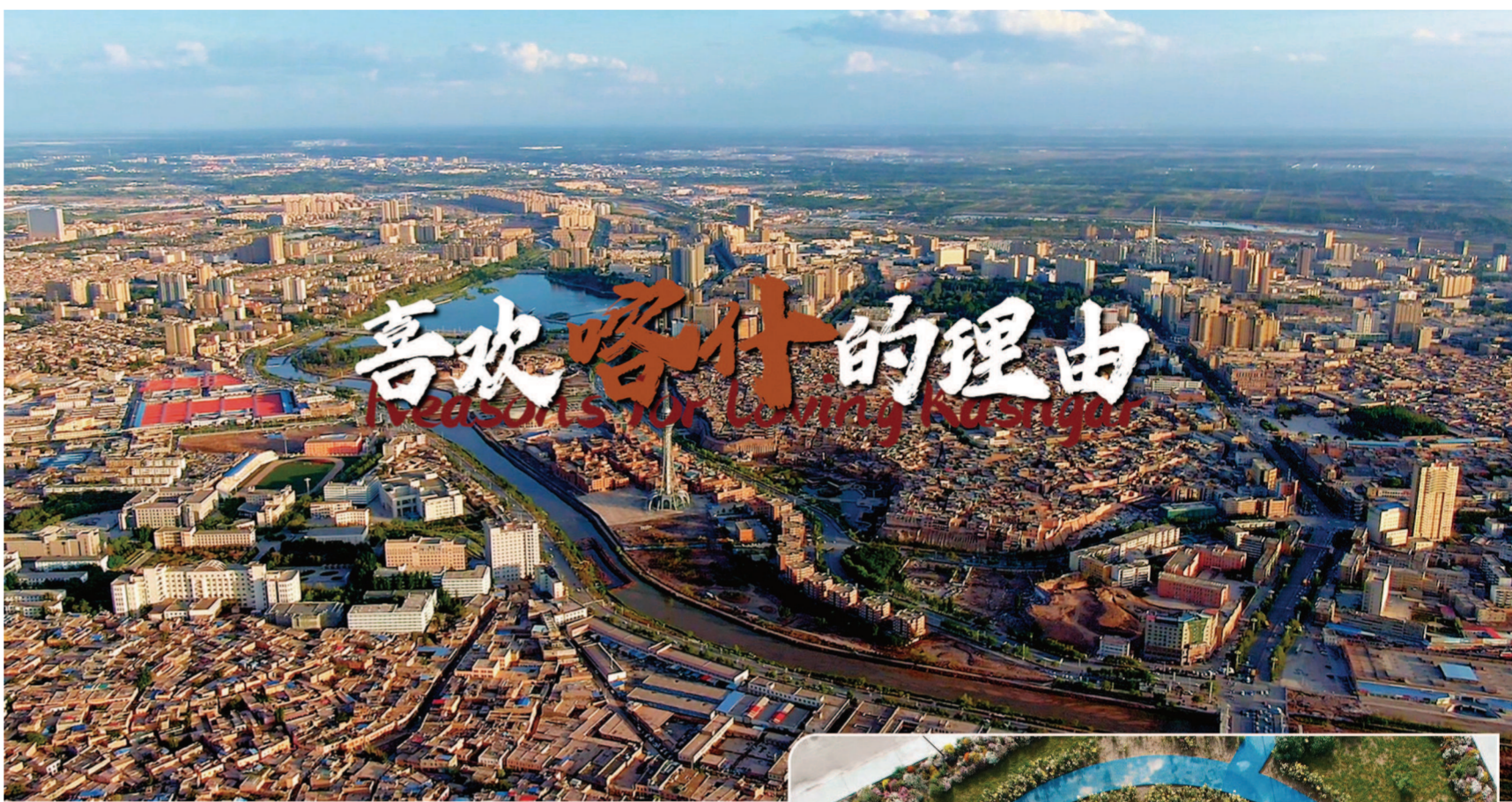
《喜欢喀什的理由》系列微纪录片宣传图。

荒地村在保留传统乡村风貌的同时，将花、月、夜等传统文化元素与现代元素创新融合，建立了“叶河花月夜”景区，并在其中打造了叶河繁花游客综合服务中心、玫瑰花婚礼、花田喜事婚庆宴会厅、七彩花田等16个打卡点。