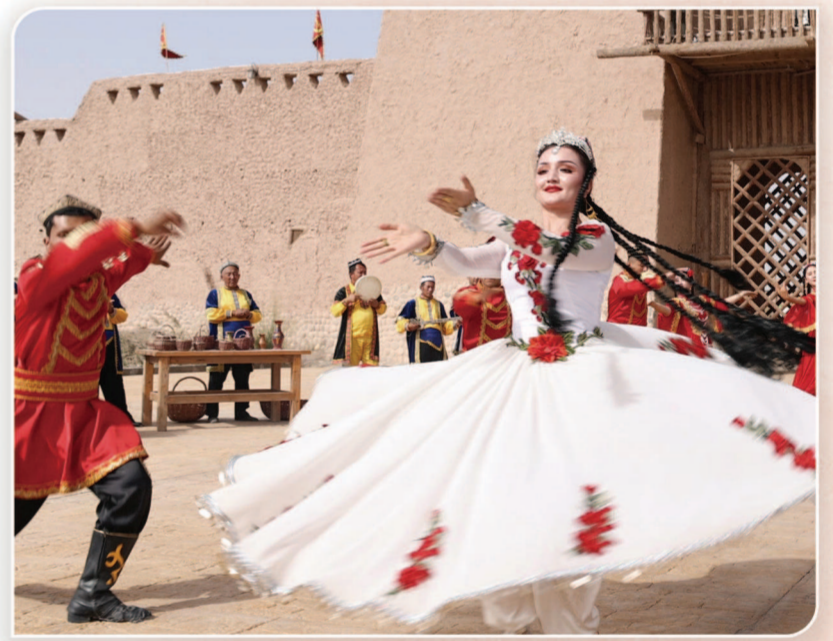
巴楚红海景区开城仪式。