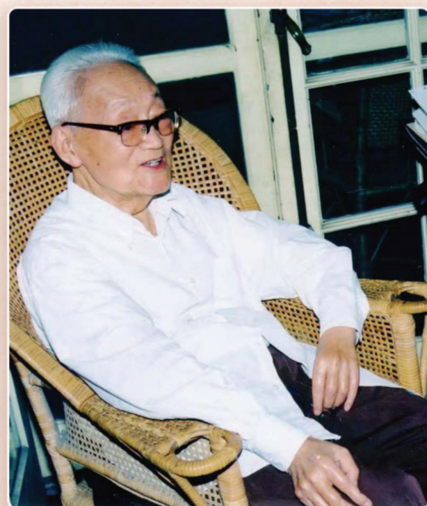
▲巴金在武康路寓所留影。