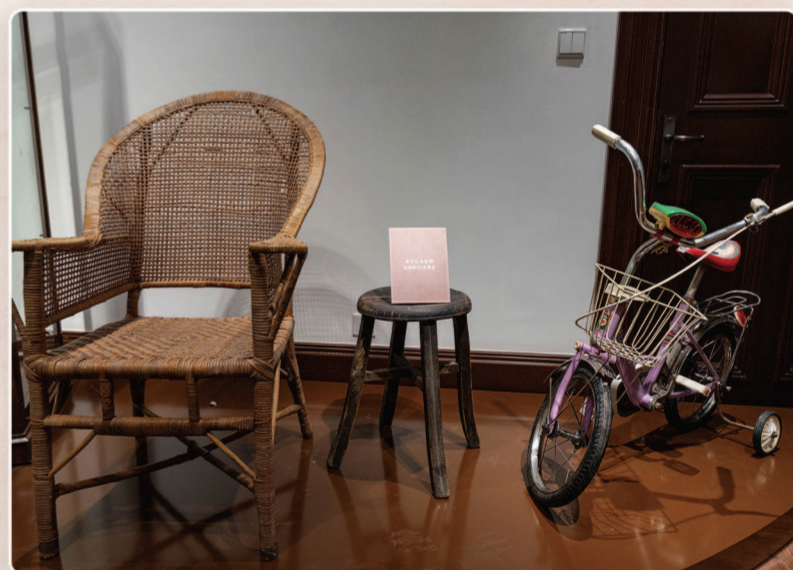
▲展区展示巴金在武康路113号的家庭用品。