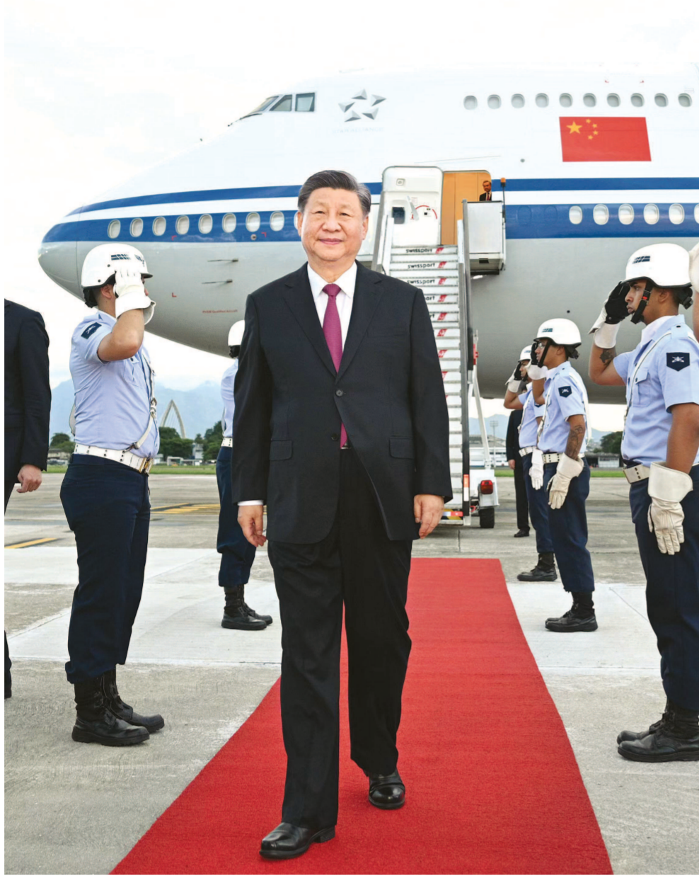
当地时间11月17日下午,国家主席习近平乘专机抵达里约热内卢,应巴西联邦共和国总统卢拉邀请,出席二十国集团领导人第十九次峰会并对巴西进行国事访问。