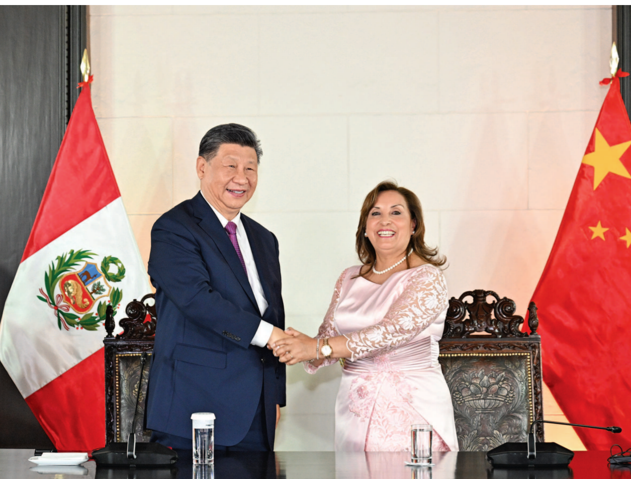
当地时间11月14日晚，习近平同秘鲁总统博鲁阿尔特在利马总统府以视频方式共同出席钱凯港开港仪式。