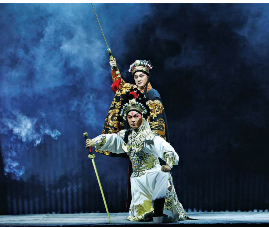
睽违十年,上海京剧院再推历史新编剧《武帝刘彻》。