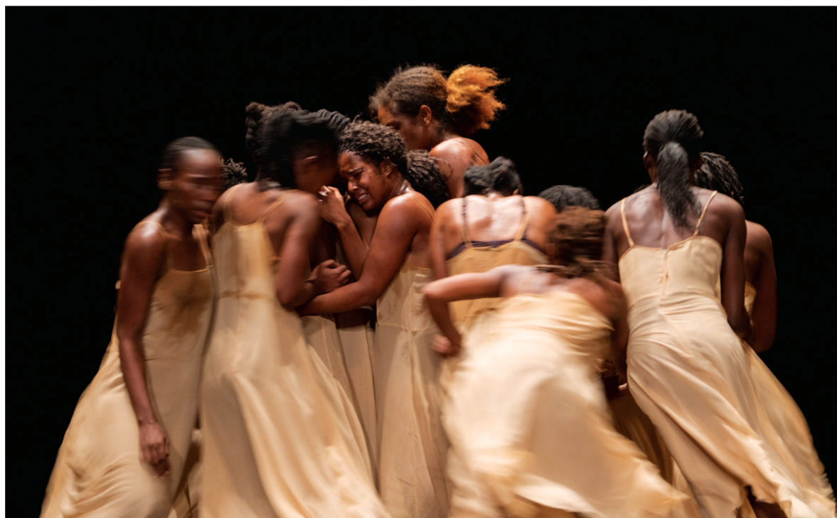
此次登上申城舞台的《春之祭》(非洲版)是皮娜·鲍什基金会、萨德勒之井剧院和塞内加尔非洲传统与当代舞蹈国际中心于2019年联合复排的剧本。

舞台上,酣畅的《春之祭》临近尾声——每一位舞者身上都沾满汗水和泥土,淋漓尽致地展现野性诗意之美。他们用非洲大陆的狂野生命力,回应着皮娜对生命与艺术的叩问:“知道自己即将死去,你将如何跳舞?” 作为20世纪最伟大的编舞家之一,皮娜·鲍什的作品是现代舞学习者的“教科书”。创作于1974年的《春之祭》是皮娜的代表作之一,以独特视角艺术演绎原始部落迎接春天的祭祀之礼。随着舞者肢体律动,原始仪式的力量渗透进人类的情感冲突中,造就了这部具有革命性的作品。此次登上申城舞台的《春之祭》(非洲版)是皮娜·鲍什基金会、萨德勒之井剧院和塞内加尔非洲传统与当代舞蹈国际中心于2019年联合复排的版本。“我与杰曼·阿科尼见面,聊到《春之祭》走进非洲的计划。最初,她对生命的想法感到震惊,但马上就表示认同,并全身心投入进来。我们在美丽的塞内加尔合作,终于创作出这一杰出的作品。”皮娜之子罗里·鲍什说。