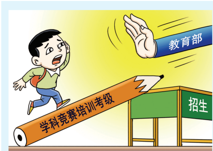
教育部多次出台文件，强调面向中小学生的全国性竞赛结果均不作为中小学招生入学的依据。

都说小托福和AMC成绩是拿到“三公”面试机会的敲门砖，那怕最后去不了“三公”，回头就谈对初中的