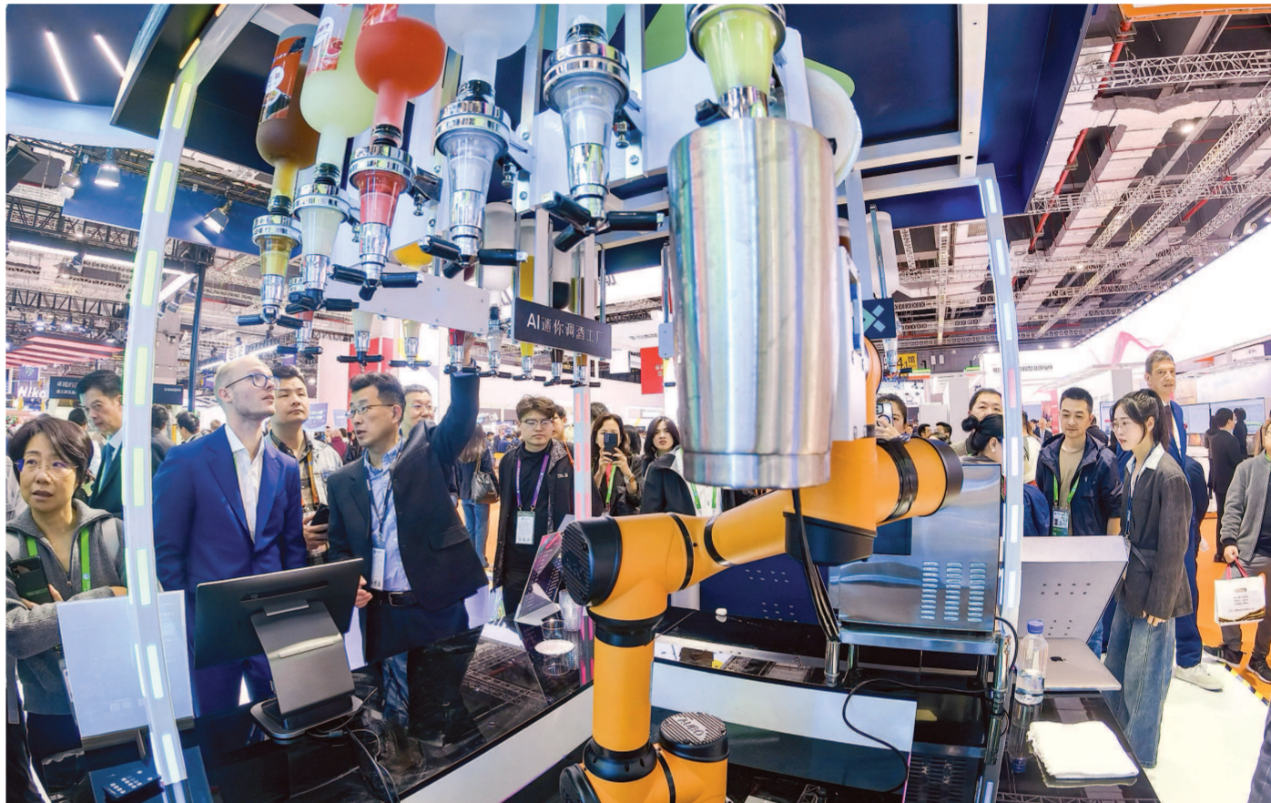
第七届进博会技术装备展区西门子展台的AI迷你调酒工厂。

在许多人看来,本届进博会的亮点就是围绕新质生产力成功构建了一个大磁场。实际上,这既是主办方积极策展的结果,更是我国创新经济生命力和吸引力的表现和证明。