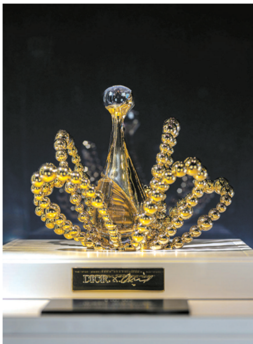
▲迪奥真我倾世之金香精金致玫瑰限量版,由法国知名艺术家让-米歇尔·奥托涅尔倾心打造,其细颈香水瓶轻盈而珍贵,稳稳立于由璀璨铜金珠组成的玫瑰花座上,以盛装弗朗西斯·柯尔创作的首款真我系列香水——迪奥真我倾世之金香精。