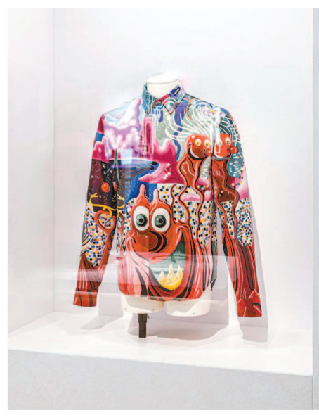
▲第七届进博会迪奥展区。