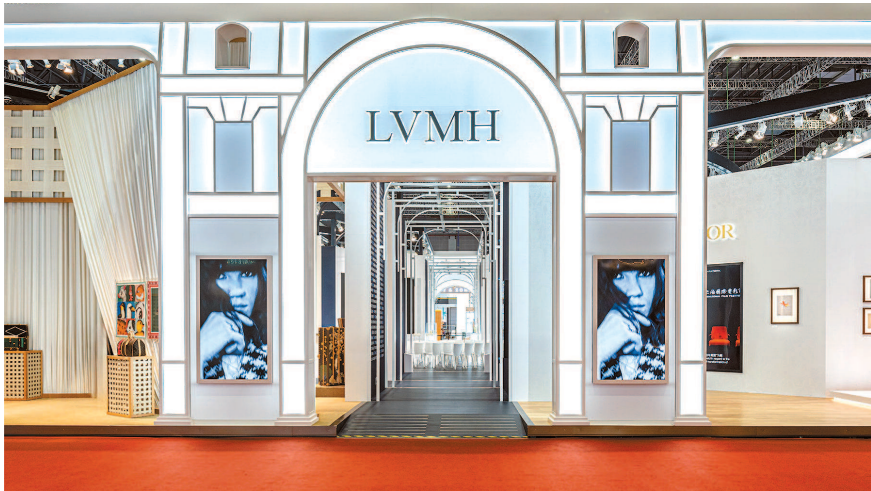
▲迪奥携手LVMH路威酩轩集团旗下众品牌第五次亮相中国国际进口博览会。

恰逢中法建交六十周年,今年的迪奥展区,中国灵感成为一大重要元素。迪奥此次参加中国国际进口博览会,特别甄选了一系列凝聚品牌卓越精神的匠心臻作,续写品牌与中国的情缘,也展现中法两国源远流长的友谊。其中,多个展品都由中国艺术家诠释,或灵感来源于中国传统文化。