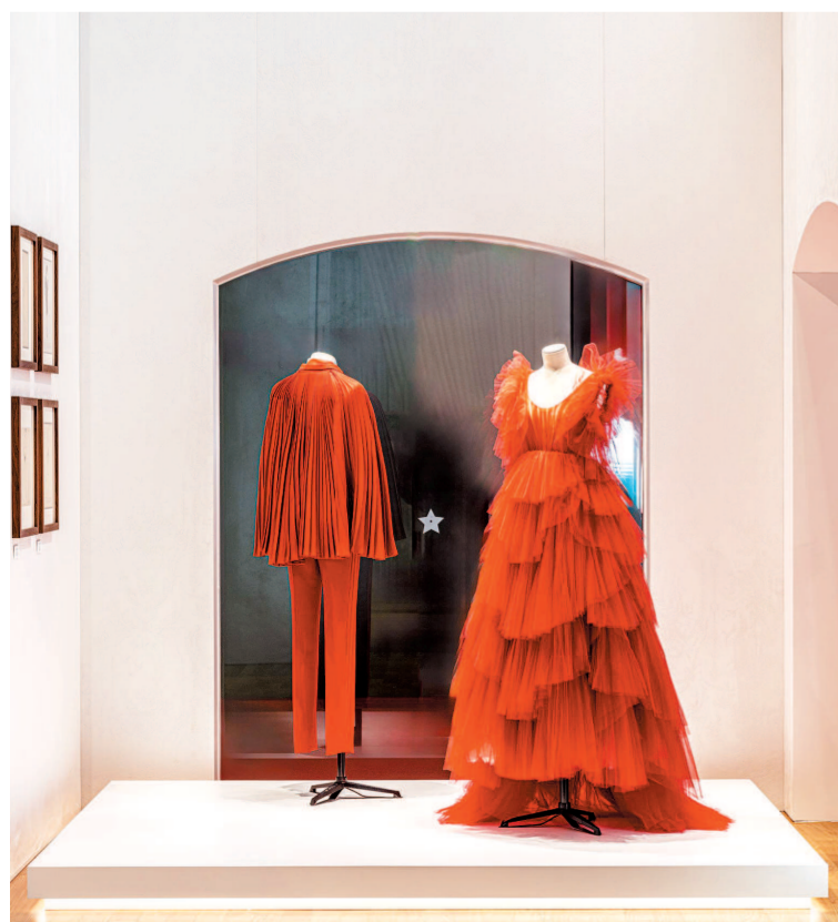
▲2018年3月29日,克里斯汀·迪奥于上海东岸·民生艺术码头举办迪奥二零一八春夏高级订制系列发布秀及超现实假面舞会。为庆祝与中国的深厚情缘,迪奥女装创意总监玛丽亚·嘉茜娅·蔻丽以扇子的雅致造型为灵感,倾情设计全新佳作——“爱之日”礼服套装和“红色天使”礼服裙。