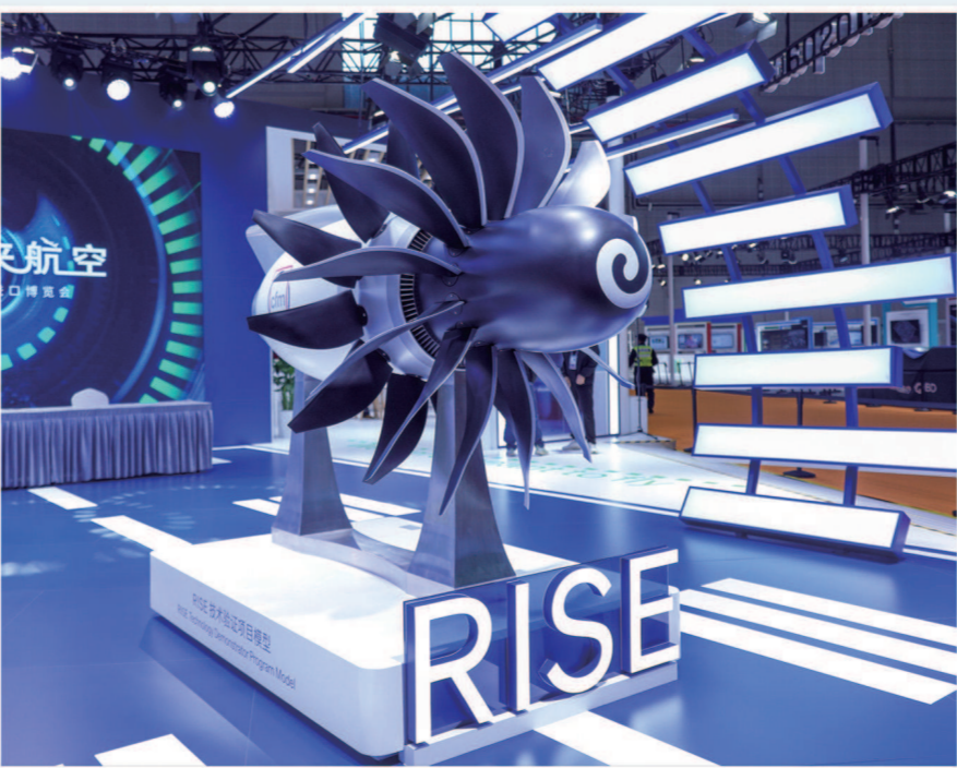
▲GE航空航天的 RISE技术验证 项目模型。