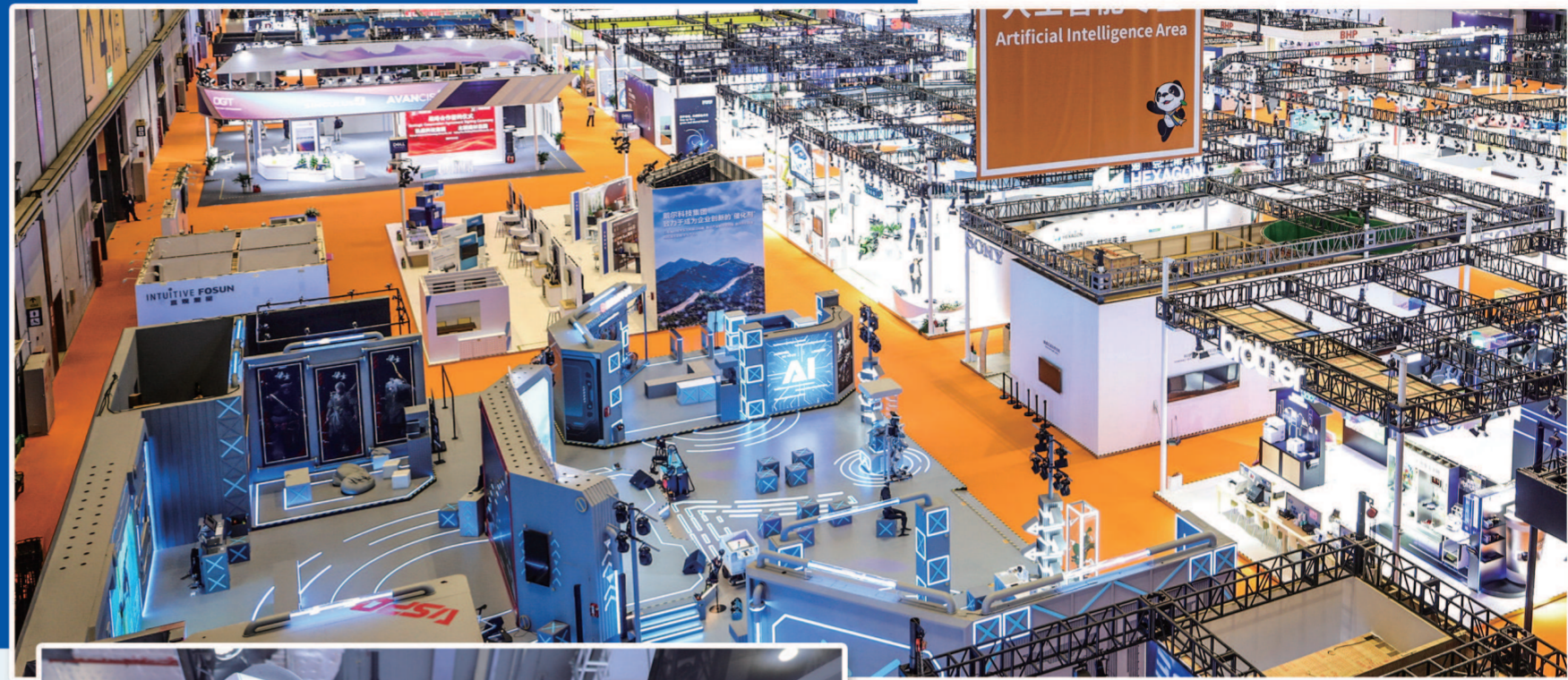
▲第七届进博会3号馆的展区、展位。 ▲光学巨头蔡司带来高端手术显微镜。

追求数字化、智能化、绿色低碳化的趋势在技术装备展区尤为明显。本届进博会上,东芝将展示一款锂离子电池,该电池使用钛酸锂作为负极材料,在满足大容量、高功率密度需求的同时,还具有寿命长、低温性能好等特点,可应用于新能源汽车、AGV搬运机器人等场景。永恒力则以“智联Cool”为核心主题,展示首秀产品——融合先进视觉识别系统的永恒力箱堆垛机,并首发SMART Plus软件。