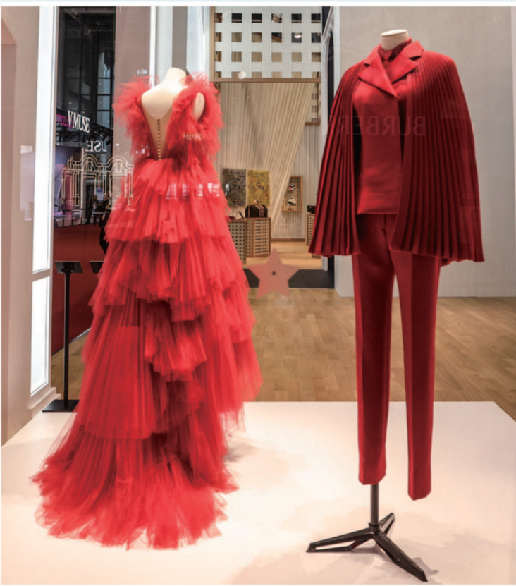
▲迪奥展台展出的 高定服装。