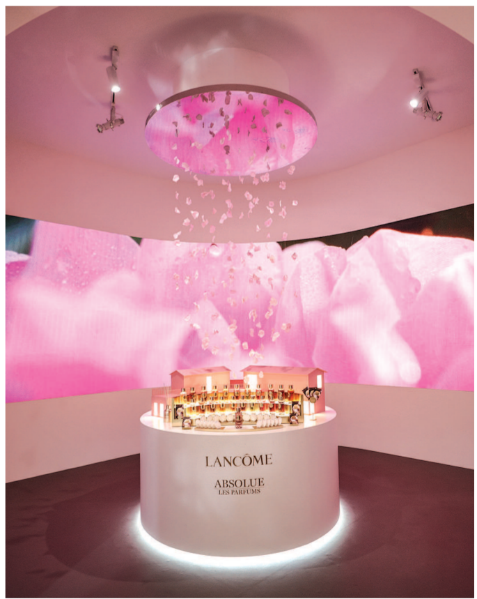
欧莱雅带来全球新品、爆款美妆科技及可持续消费跨界合作项目的首发首秀。