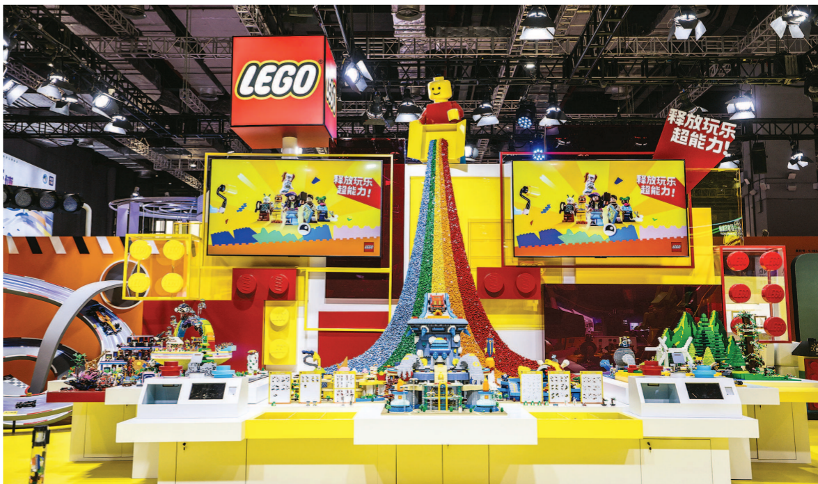
左图：优衣库连续五年参展，积极助力“展品变商品”。 右图：乐高集团为本届进博会打造的主题装置“释放玩乐超能力”是乐高集团参展以来参与共创人数最多的主题装置。