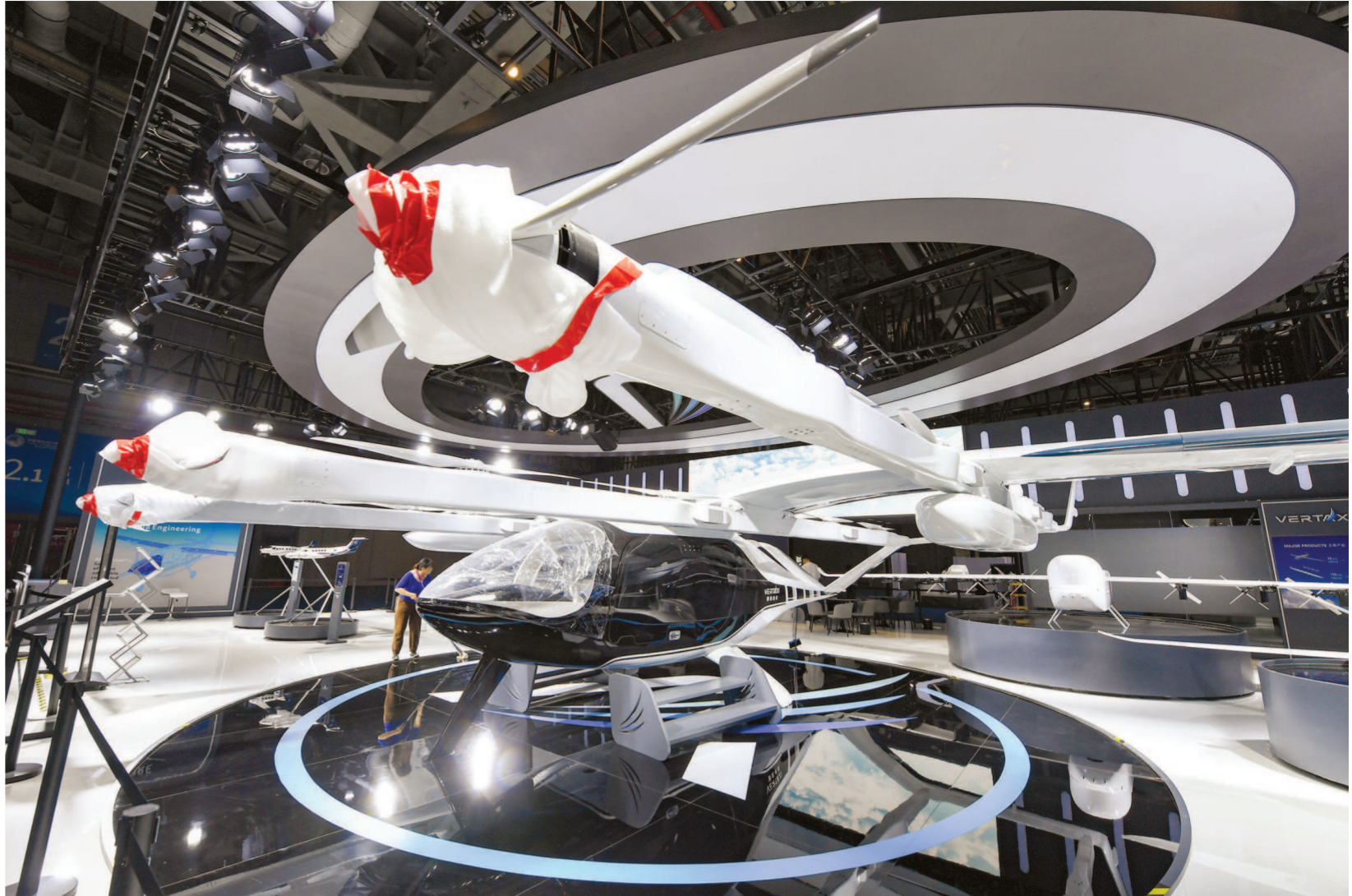
本届进博会最大展品电动垂直起降飞行器M1 eVTOL。