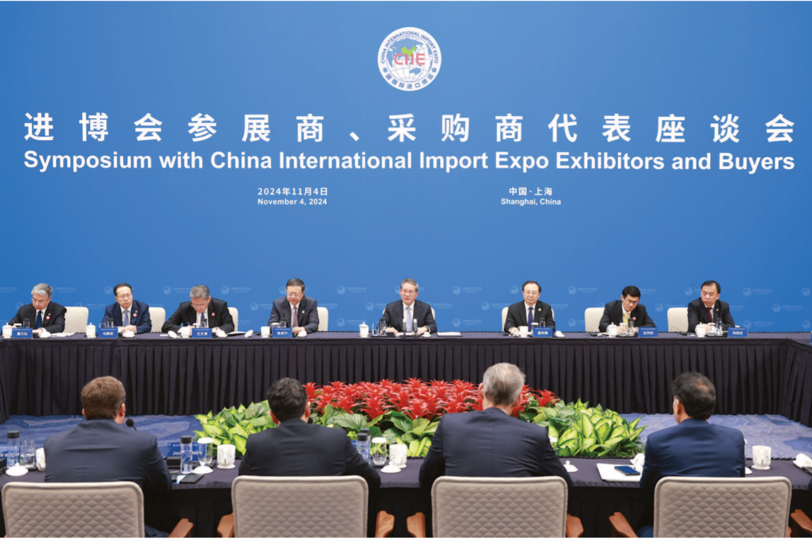
进博会参展商、采购商代表座谈会 Symposium with China International Import Expo Exhibitors and Buyers 2024年11月4日 November 4, 2024 中国·上海 Shanghai, China