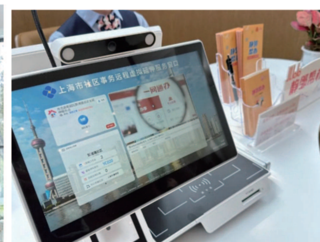
SAP(中国)科创赋能中心。▲智办·企业服务点。