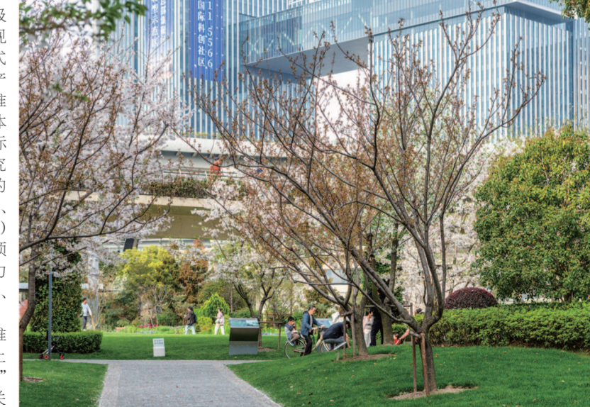
静安国际科创社区。

内容，感到特别实用，“这些对我们帮助很大，能够快速知道申报项目的匹配度。”据悉，作为园区政企通服务的又一“前移窗口”，“智办”企业服务点依托上海市“一网统办”卓越的网办能力，以及静安区“静心帮办”“静邻帮办”两大政务服务品牌的服务团队，构建了“一体化智能服务矩阵”，打通了政务服务“最后一公里”，带来“园区事、园区办”的服务新体验。