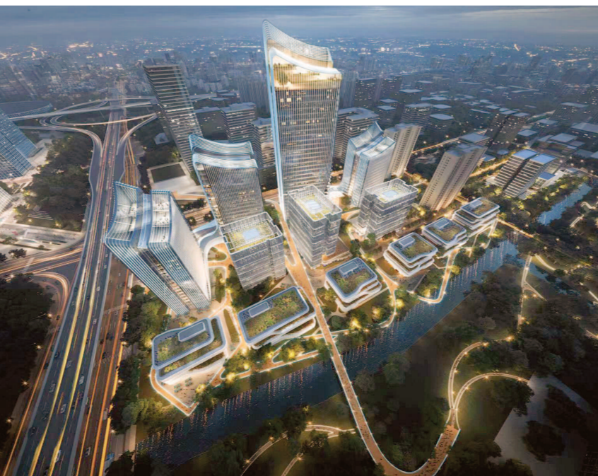
走马塘城市更新区效果图。

区用地转型升级，新兴产业能级提升。当前，该区域大力瞄准静安生命健康产业优势，发挥市北高新园区应用智能产业比较优势，推动新技术、新业态集群化、规模化发展，以“数智+总部+研发”叠加效应成为中心城区生命健康总部集聚、生命健康产业活跃、数字健康医疗领先的生产发展新高地。