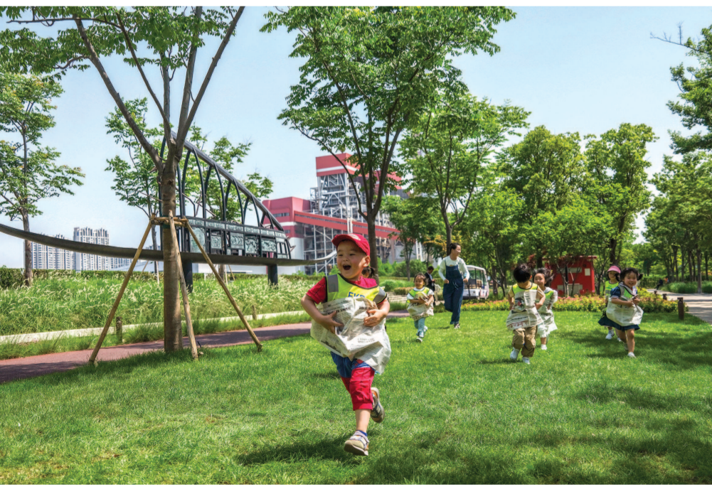
杨树浦电厂净水池改造。

在由百年火电厂净水池改造而成的零碳咖啡馆里小坐片刻,到明华糖仓变身而来的公共空间看一场关于未来科技的展览,江风拂过,江岸上守望多年的钢铁家伙都变得温柔起来,曾经“生人勿近”的工业建筑,焕新后承载起更多元的现代功能。作为杨浦新一轮发展的重点区域、践行人民城市理念的核心区域,杨浦滨江经过5年的接续开发建设,如今被提起,“生活秀带”总是第一个出现的关键词。5年来,杨浦滨江已然成为人们熟知并喜爱的生活场域。