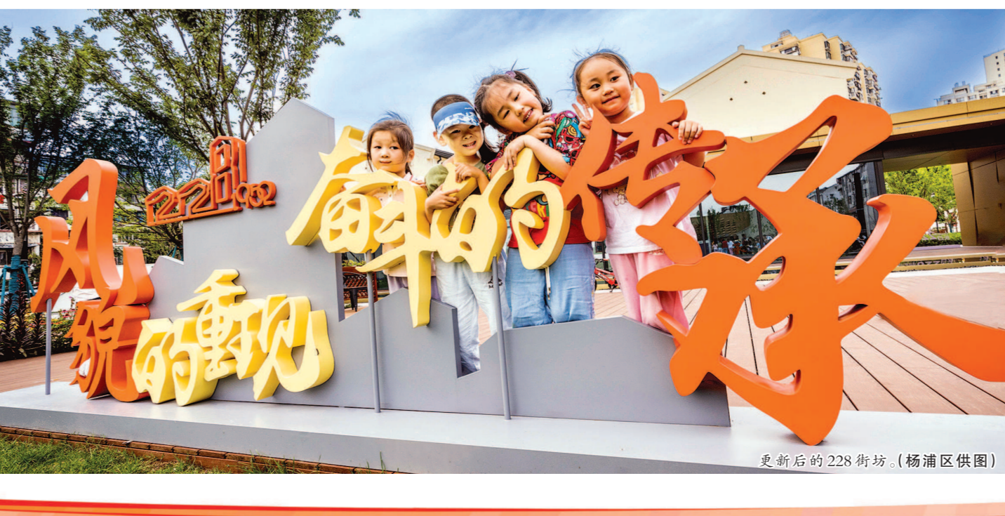
更新后的228街坊。