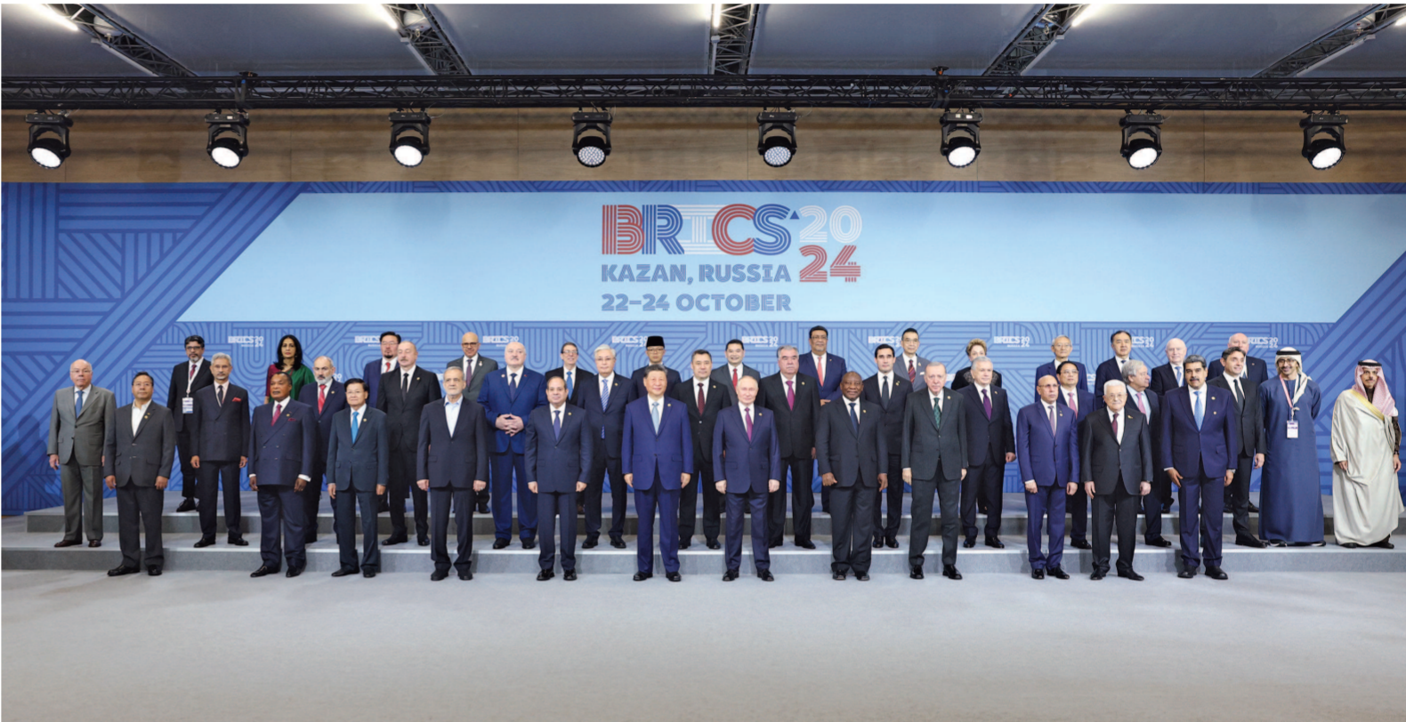
当地时间10月24日上午，国家主席习近平在喀山会展中心出席“金砖+”领导人对话会并发表题为《汇聚“全球南方”磅礴力量 共同推动构建人类命运共同体》的重要讲话。这是出席对话会的金砖国家及嘉宾国领导人或代表、国际组织负责人集体合影。