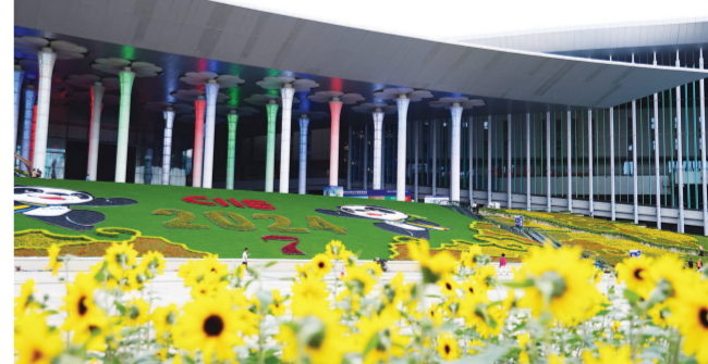
国家会展中心（上海）南广场花园锦绣，迎接即将开幕的第七届进博会。