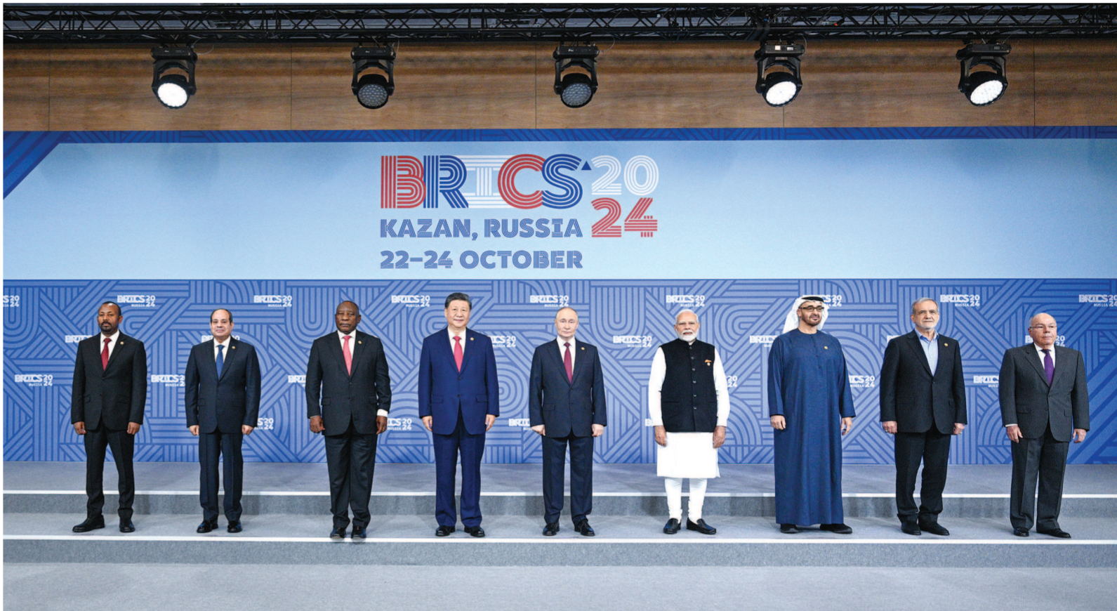
当地时间10月23日上午,金砖国家领导人第十六次会晤在喀山会展中心举行。俄罗斯总统普京主持会晤。中国国家主席习近平、巴西总统卢拉(线上)、埃及总统塞西、埃塞俄比亚总理阿比、印度总理莫迪、伊朗总统佩泽希齐扬、南非总统拉马福萨、阿联酋总统穆罕默德等出席。这是会晤期间,金砖国家领导人集体合影。