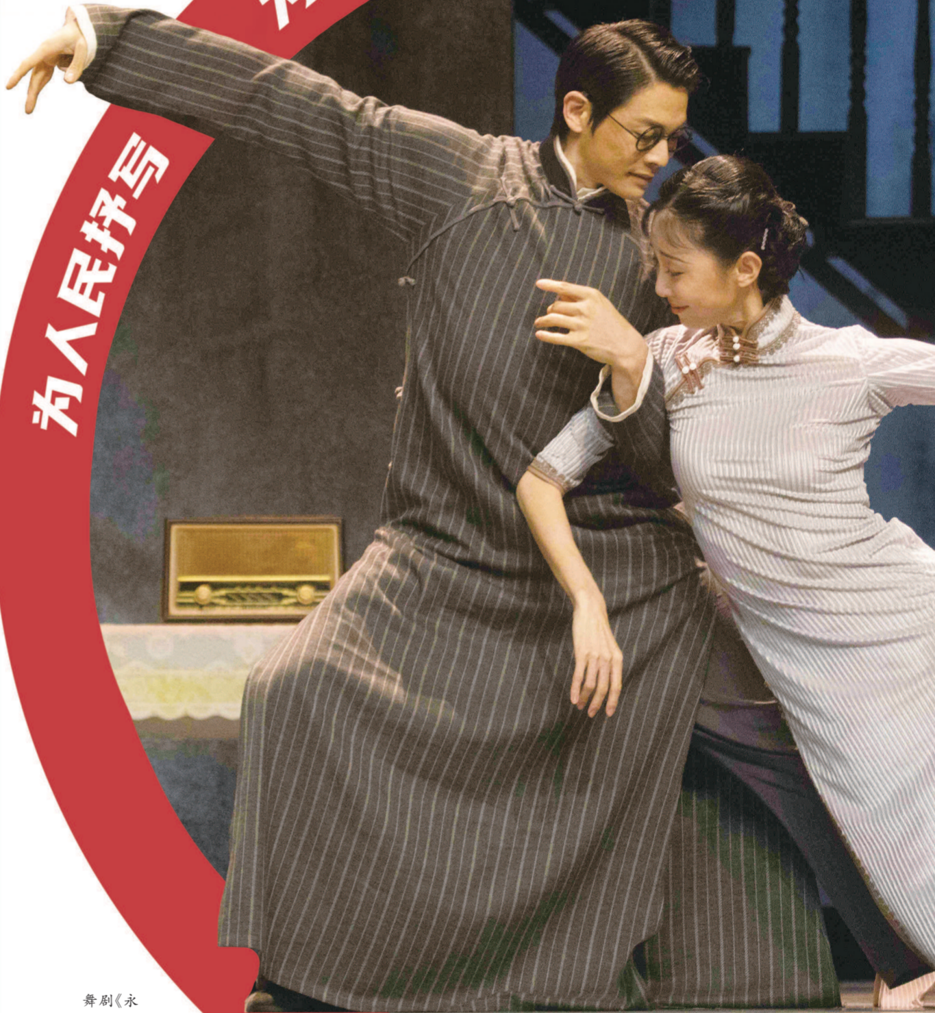
舞剧《永不消逝的电波》剧照。