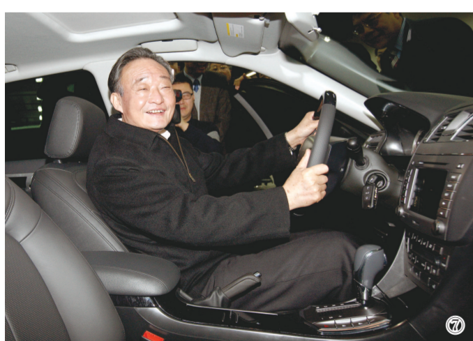
图⑦:2010年1月30日,吴邦国同志在上海汽车集团股份有限公司技术中心察看新能源车。