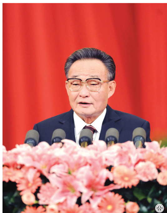
图⑧:二〇一一年三月十日,十一届全国人大四次会议在北京人民大会堂举行第二次全体会议。吴邦国同志作全国人大常委会工作报告。