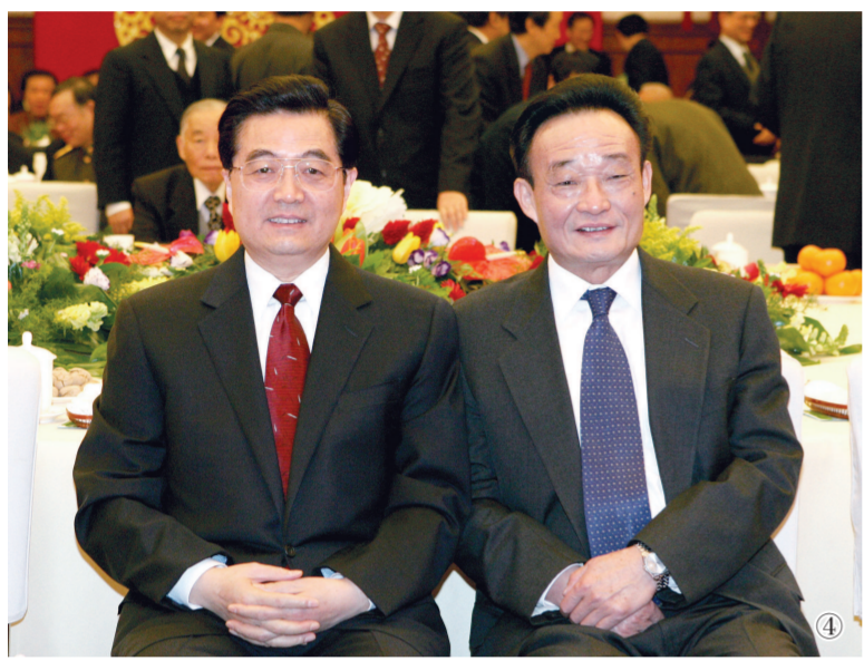
图④:二〇〇五年一月一日,全国政协在北京举行新年茶话会。这是胡锦涛同志与吴邦国同志在一起。