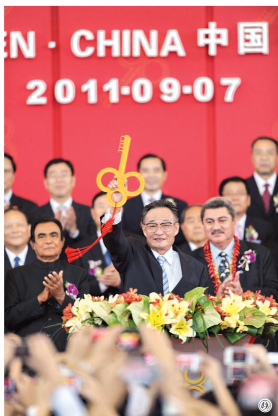
图⑨:二〇一一年九月七日,吴邦国同志在福建厦门出席第十五届中国国际投资贸易洽谈会开幕式。