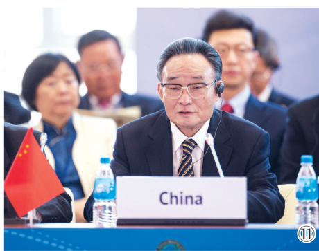
图⑪:2013年1月28日,吴邦国同志在俄罗斯符拉迪沃斯托克出席亚太经合论坛第21届年会,并作题为《坚持和平发展 促进合作共赢》的主旨发言。