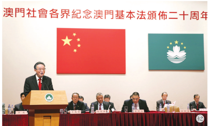
图⑫:2013年2月21日,吴邦国同志在澳门文化中心出席澳门社会各界纪念澳门基本法颁布20周年启动大会并发表讲话。