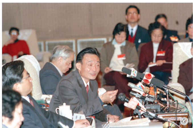
图⑤:1994年3月,时任上海市委书记的吴邦国同志在全国两会上海代表团全团会议上。