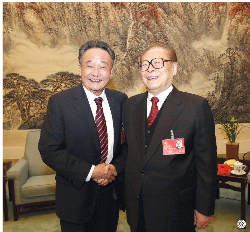
图③:2012年11月14日,中国共产党第十八次全国代表大会在北京闭幕。这是闭幕会前,江泽民同志与吴邦国同志在一起。