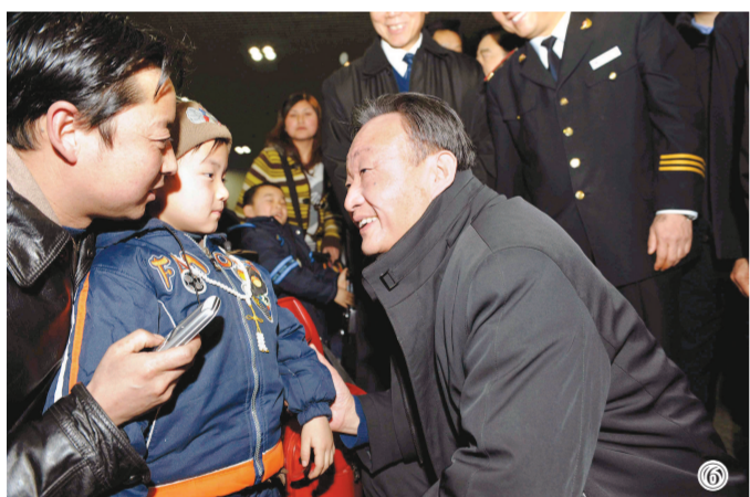
图⑥:2008年2月3日,吴邦国同志在北京西站候车室与旅客交谈。