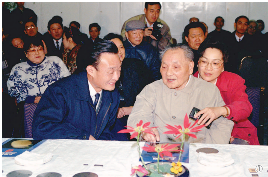
图①:1992年2月10日,邓小平同志在上海贝岭微电子制造有限公司参观时与吴邦国同志交谈。