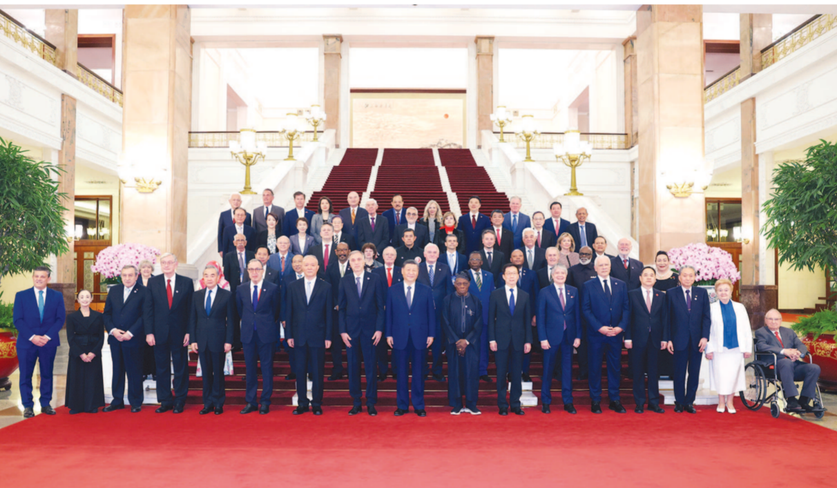
10月11日上午,国家主席习近平在北京人民大会堂集体会见出席中国国际友好大会暨中国人民对外友好协会成立70周年纪念活动的中方外方嘉宾。这是习近平同部分中方外方嘉宾代表合影留念。