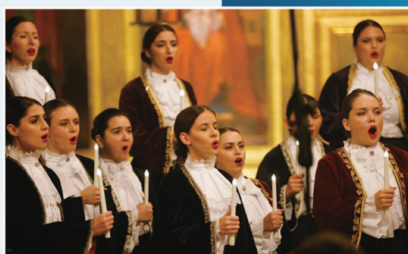
▲贝尔格莱德青年学术合唱团音乐会。

在今年“艺术天空”的主题策划中，创新力和年轻力是贯穿始终的关键词。在“庆祝中华人民共和国成立75周年”系列演出中，著名指挥家汤沐海率领年轻的陶溪