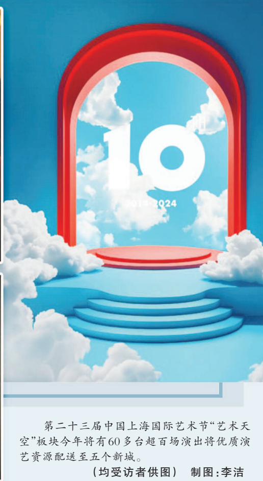
第二十三届中国上海国际艺术节“艺术天空”板块今年将有60多台超百场演出将优质演艺资源配送至五个新城。 制图:李洁

今年，“艺术天空”推出首届“Art To Gather新天地艺季”，分别在新天地、瑞虹天地、虹桥天地、创智天地、湾谷坊五个主要场地，以戏剧、音乐、舞蹈、巡游、快闪、工作坊等艺术形式为观众呈上一场场流动的视听盛宴。据悉，首届新天地艺季以多元融合为主题，将呈现法国音乐喜剧《鲑鱼》、经典歌剧《费加罗的婚礼》、中法