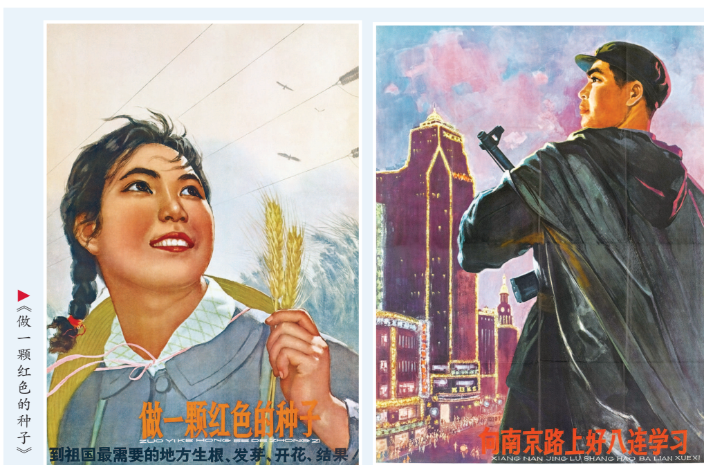
《做一颗红色的种子》

与展览同期，“十四五”国家重点出版物出版规划项目“强国图志”系列继《强国图志：从宣传画里看新中国发展之路》《大地芳华：宣传画里的新中国女性形象》后，推出第三本《人民至上：年画、连环画、宣传画里的新中国百姓生活》。