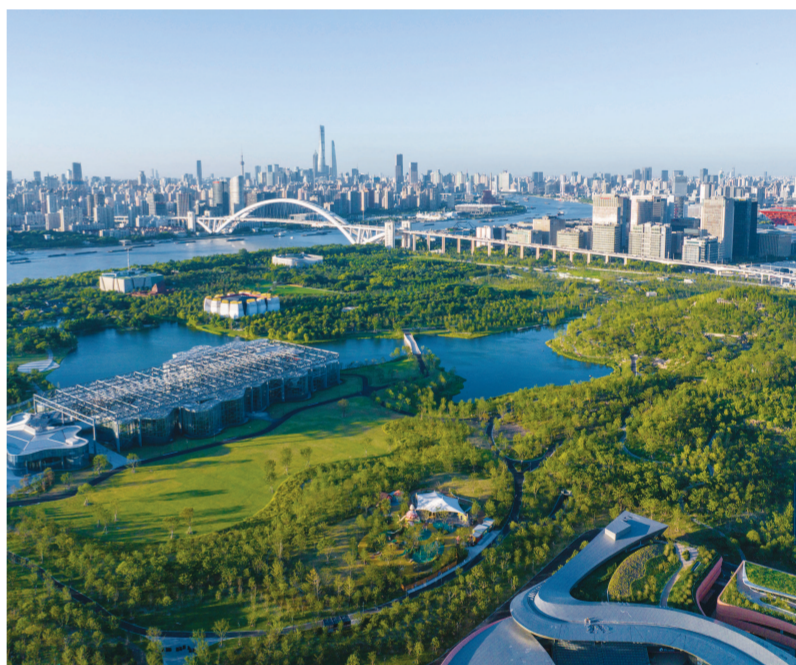
上海世博文化公园南区今年9月20日全面开放。

征程万里风正劲，重任千钧再奋蹄。浦东新区将深入贯彻落实习近平总书记考察上海重要讲话精神，勇挑重担，勇立潮头，追求卓越，争创一流，加快打造社会主义现代化建设引领区，为中国式现代化作出更大贡献。