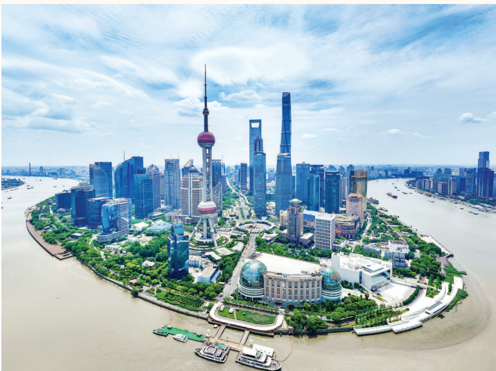
在新中国75年的奋斗岁月中，浦东这片热土成为改革与开放的鲜明地标。