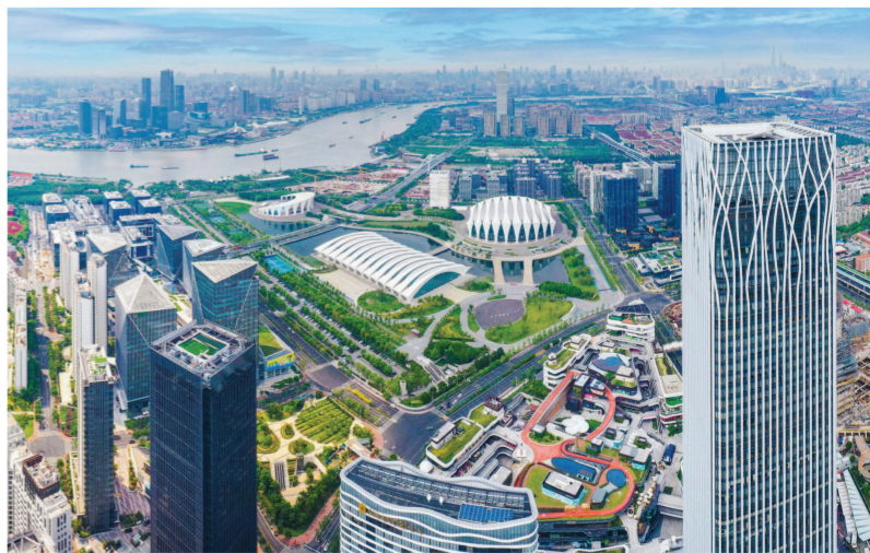
经过30多年发展，浦东从过去以农业为主的区域，变成一座功能集聚、要素齐全、设施先进的现代化新城。