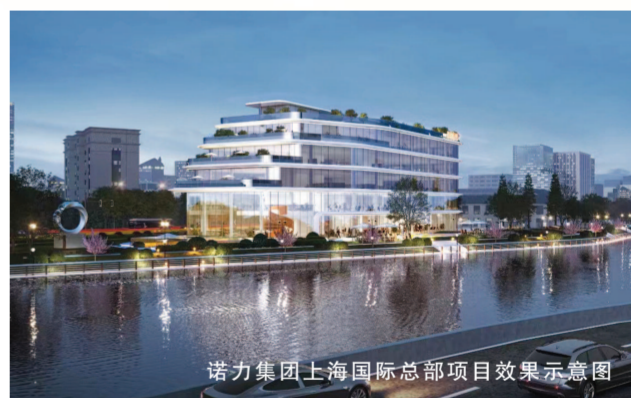
诺力集团上海国际总部项目效果示意图