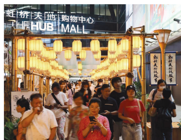
虹桥国际中央商务区以“大科创”赋能“大商务”“大会展”“大交通”，功能建设成效明显，成为上海经济发展的强劲活跃增长极。