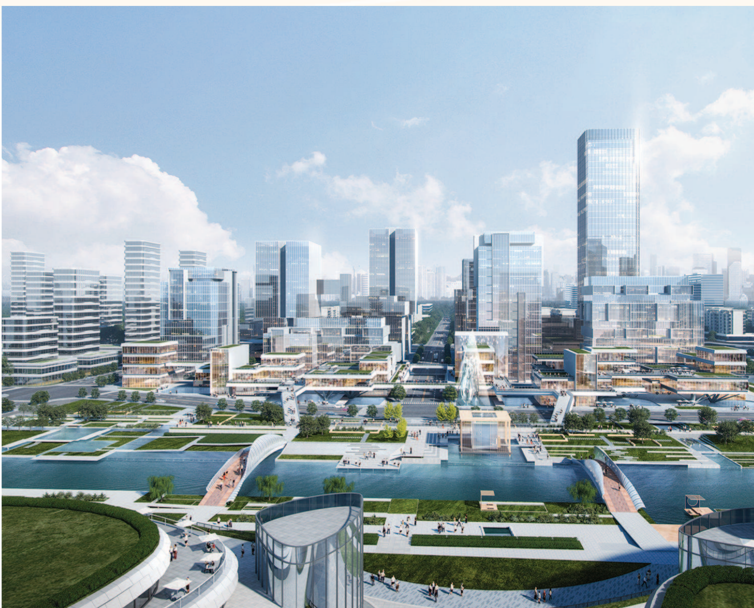
除了做足服务生态的软实力之外，高速成长的南虹桥也在生态环境上下苦功，建设高品质生活的人民城市样板区。

国内龙头企业纷纷登陆南虹桥，以实现全球化“新一跃”。看到了这样的路径趋势，南虹桥加快建设“走出去”功能平台，进一步优化完善上海市“一带一路”综合服务中心（虹桥）、RCEP企业服务咨询站（虹