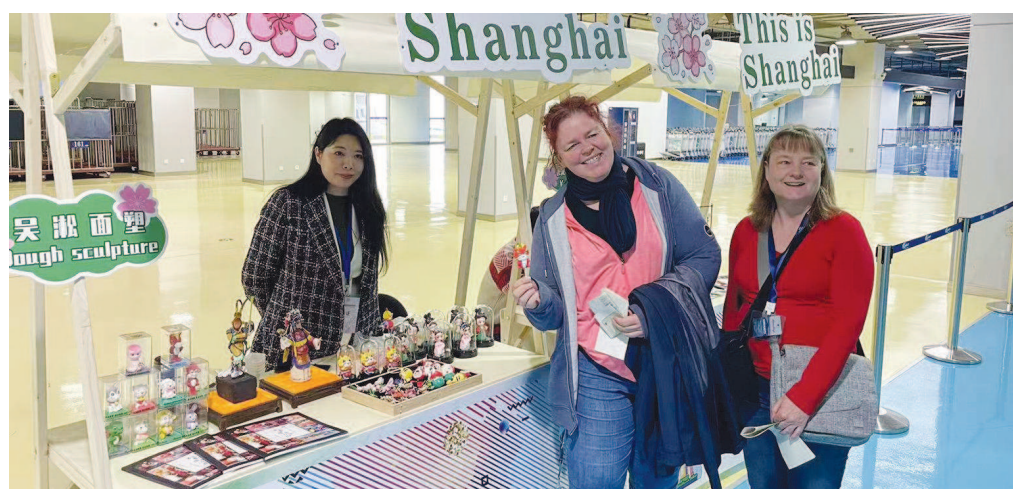
邮轮游客体验传统面塑技艺。