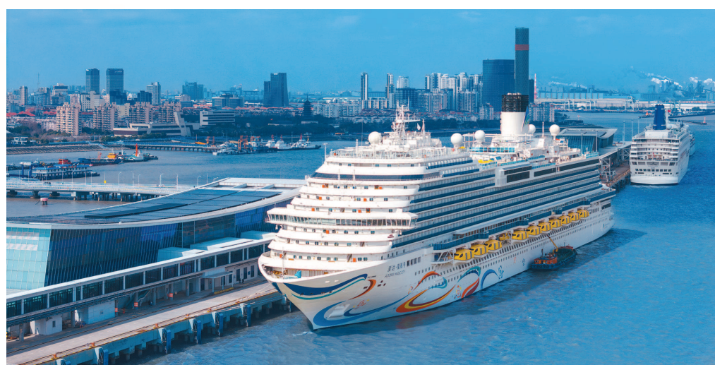
首艘国产大型邮轮“爱达·魔都号”从今年1月1日起在吴淞口国际邮轮港开启商业首航。

这桩看似赔本的生意，为何企业愿做？宝山区滨江区委相关负责人解释，滨江岸线焕新升级中引入片区概念，即不严格按照港区界限划分管理职责，通过“政府+市场”共建共治模式，让各方各司其职、高效运行。对于企业来说，他们所计算的并非是无动力乐园等单一项目能否盈利，而是算大账、算长远账。通过配套设施的衔接联通，大量客流有望从滨江岸线引向腹地，带动提升整个片区的发展能级。