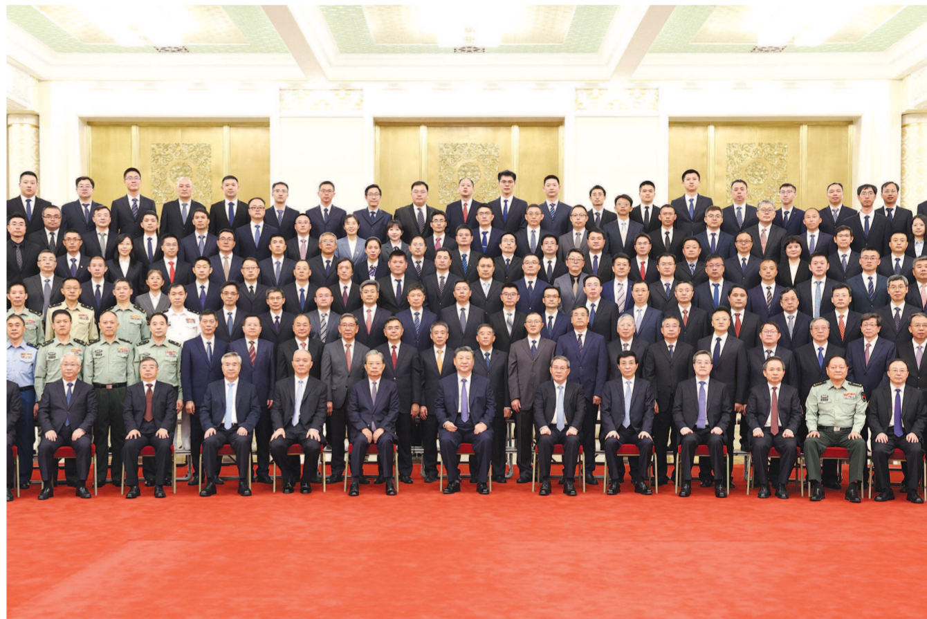
9月23日，党和国家领导人习近平、李强、赵乐际、王沪宁、蔡奇、丁薛祥、李希等在人民大会堂会见探月工程嫦娥六号任务参研参试人员代表并参观月球样品和探月工程成果展览。这是习近平发表重要讲话。