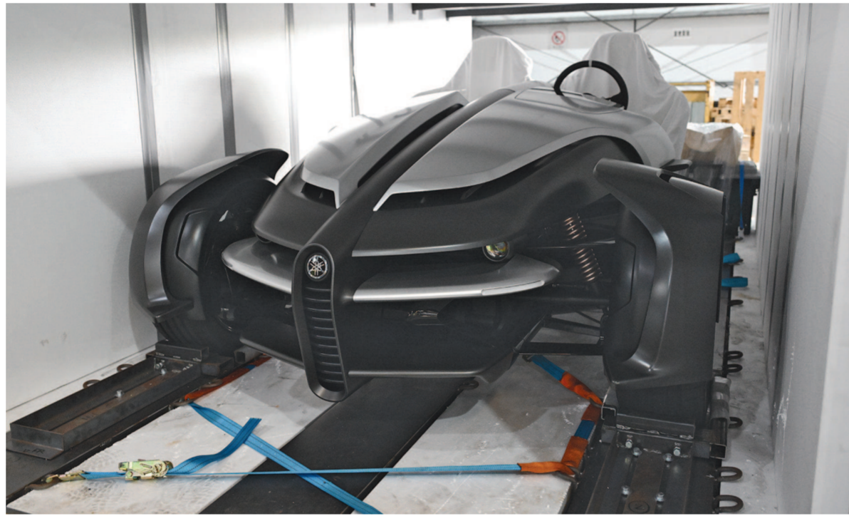
首票进境展品是来自雅马哈发动机公司的电动三轮概念车。

本报讯 (记者苏展)近日,第七届中国国际进口博览会首票进境展品——一辆雅马哈发动机公司电动三轮概念车,经上海海关监管,顺利完成全部通关手续。该展品是中国首发,拥有独特的三轮设计以及三轮转向系统。