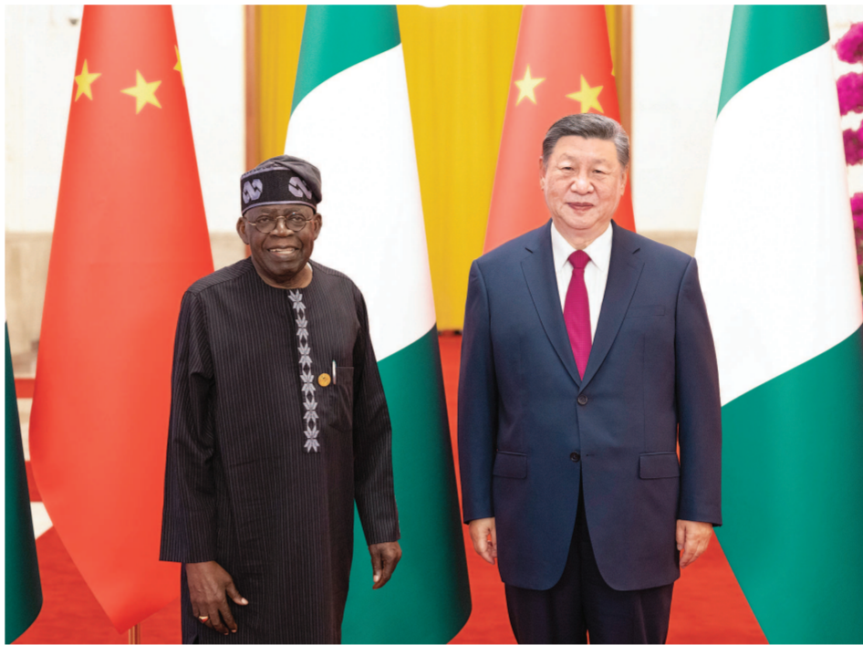
9月3日下午，国家主席习近平在北京人民大会堂同来华出席中非合作论坛北京峰会并进行国事访问的尼日利亚总统提努布举行会谈。

新华社北京9月3日电（记者郑明达 袁睿）9月3日下午，国家主席习近平在北京人民大会堂同来华出席中非合作论坛北京峰会并进行国事访问的津巴布韦总统姆南加古瓦举行会谈。