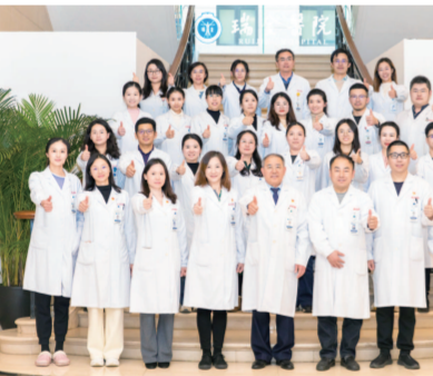
腿保住了，阿姨只需好好修养，待骨折愈合。

病理科医生又称“医生的医生”，这个医院里的公共平台，地位举足轻重——每个学科可能都会与病理科相关，病理诊断不明确，不仅难以对症治疗，更可能导致误诊误判，付出生命的代价。