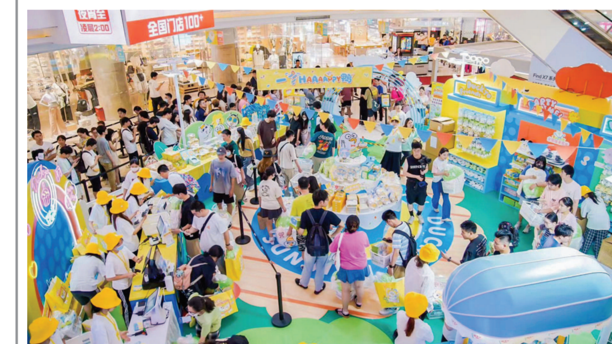
龙之梦城市生活中心举办的夏日活动,吸引了大量顾客前来打卡体验。