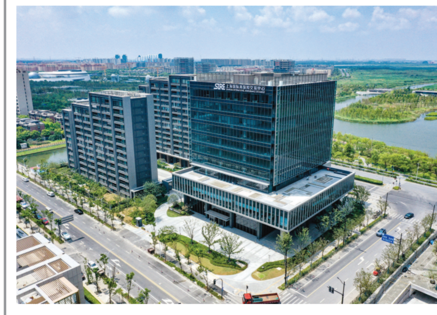
坐落于临港新片区的上海国际再保险交易中心。

临港新探索 ■本报记者 周渊 滴水湖畔,上海国际再保险登记交易中心大厦前不久建成投用。作为国内唯一的再保险交易市场,平台对标伦敦金融城的“保险超市”“劳社”,建立了一套“前市后司”交易模式——“前市”即交易市场,在大厦一楼和二楼都设有开放的交易大厅和席位,各再保险机构可以直接进行撮合交易;而“后司”则是楼上的运营中心,当场就能对账、出单结算。 仅用不到100天时间,临港国际再保险功能区已初具规模,15家再保险运营中心和3家保险经纪公司入驻,2024年力争实现再保险分保费收入100亿元,将加快打造成为立足中国、辐射全球的金融再保险中心。 上海国际金融中心建设正以时不我待、只争朝夕的紧迫感加快推进。站在改革开放最前沿,临港新片区在金融领域持续推进首创性改革、引领性开放,大力推进投资贸易自由化、