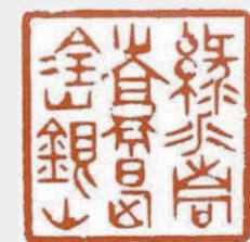
绿水青山就是金山银山 篆刻:金鑫