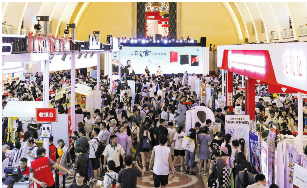
2024上海书展昨天迎来大客流,现场读者摩肩接踵,共赴书香之约。