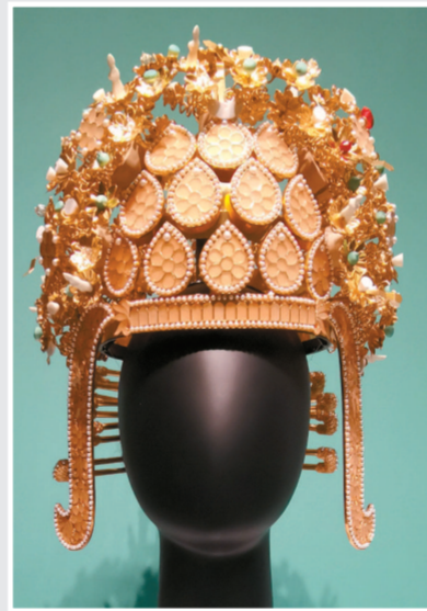
萧后钿钗礼冠(复原件)。