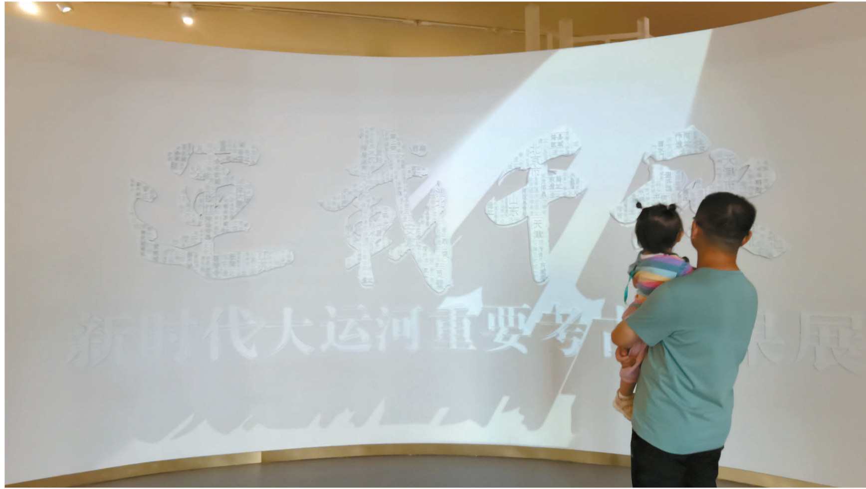
“运载千秋——新时代大运河重要考古成果展”的开展电子屏。

大运河极大便利了瓷器、食盐等货物的运输。江苏苏州元和塘古窑烧制的“金砖”在明清两代由大运河运送进紫禁