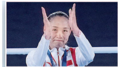
常园为中国摘首枚奥运女子拳击金牌