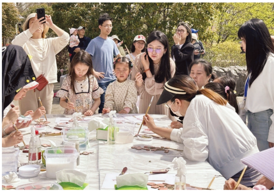
于宝山社区美术馆·公园里前举办的艺术工作坊活动。