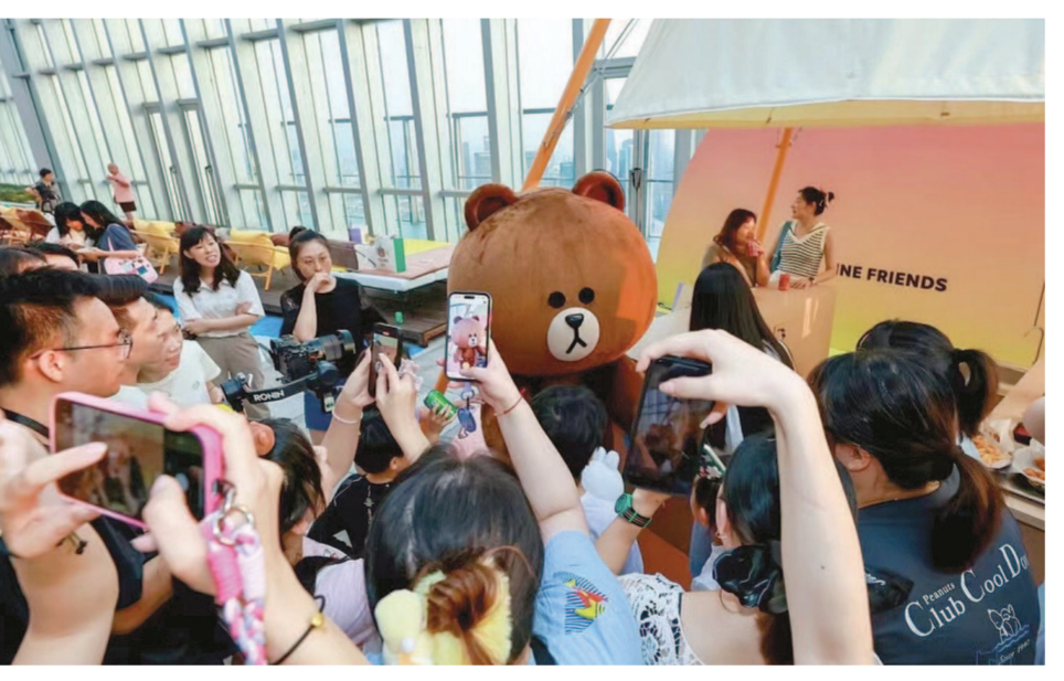
北外滩来福士推出“布朗熊客厅派对”吸引年轻消费群体。

必玩榜上，将持续至明年2月的“福尔摩斯大型沉浸式体验空间（中国上海站）”榜上有名。该展览不仅将1933老场坊展览空间还原成维多利亚时期的老克街场景，还开发面向青少年的研学项目，为全年龄段“福迷”找到消费场景。