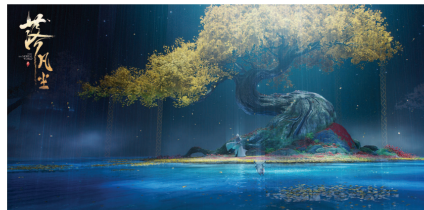
动画电影《落凡尘》剧照

在全球文化话语权争夺激烈和中国文化迫切需要走出去的当下,讲述中国故事不能满足于自说自话,而必须注