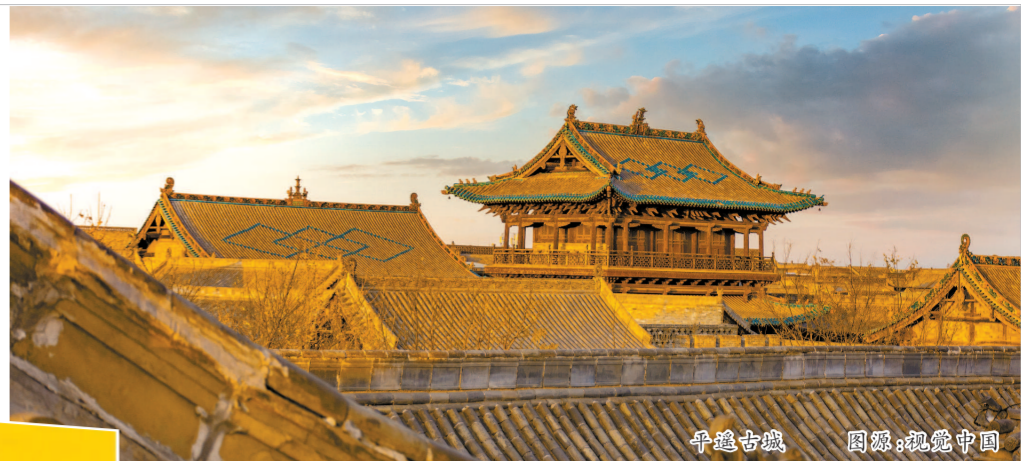
平遥古城