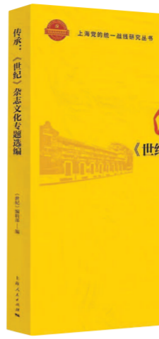
《传承：〈世纪〉杂志文化专题选编》 《世纪》编辑部编 上海人民出版社出版

为庆祝《世纪》杂志创刊30周年，《世纪》杂志编辑部从历年刊发文章中，撷取部分精萃，编辑成册，出版了《传承：〈世纪〉杂志文化专题选编》，非常值得庆贺。