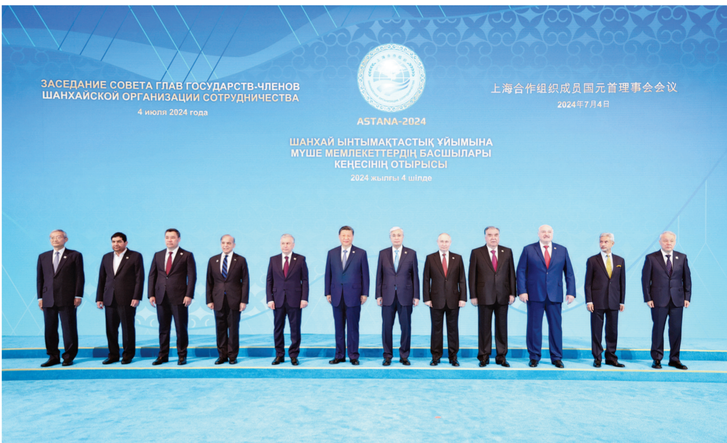
当地时间7月4日上午,国家主席习近平在阿斯塔纳独立宫出席上海合作组织成员国元首理事会第二十四次会议。这是习近平同上海合作组织成员国领导人集体合影。