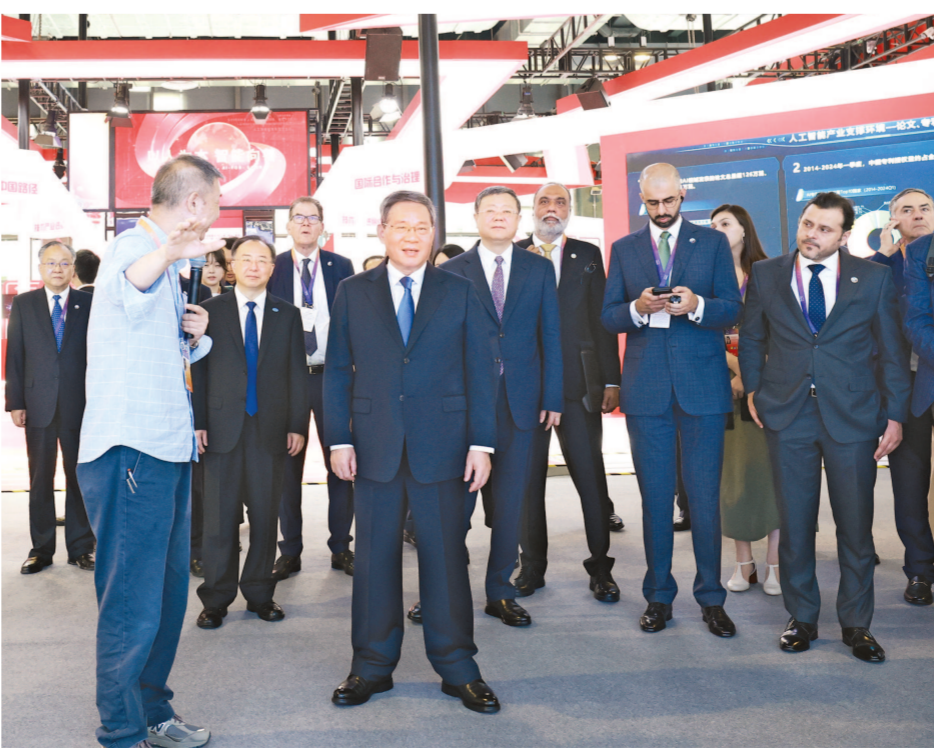
2024世界人工智能大会暨人工智能全球治理高级别会议开幕式后,李强同与会外方嘉宾、国际组织代表共同巡馆。

关、数据跨境流动、设备自由贸易和设施互联互通,加强基础研究和人才交流合作,共同维护产业链供应链安全稳定,推动创新成果不断涌现、产业发展持续突破、智能红利更大释放。二是推动普惠发展,弥合智能鸿沟。携手打造开放、公平、非歧视的人工智能发展环境,帮助发展中国家加强能力建设,推进网络、算力、数据等普惠化,为广中小企业和普通人提供低门槛、低成本的人工智能服务,实现更大程度的数字包容。三是加强协同共治,确保智能向善。加强发展战略、治理规则、技术标准等对接协调,推动建立普遍参与的国际机制,形成具有广泛共识的治理框架和标准规范,确保人工智能发展安全、可靠、可控,始终符合人类的根本利益和价值标准。 巴西联邦最高法院院长卡罗索、新开发银行行长罗塞夫、联合国工业发展组织总干事穆勒等外方嘉宾及国际组织、产学研等各界代表约1000人出席开幕式。 开幕式后,李强同与会外方嘉宾、国际组织代表共同巡馆,并与有关科研机构和企业负责人互动交流。 大会发表《人工智能全球治理上海宣言》。陈吉宁、吴政隆参加上述活动。 ▶ 《人工智能全球治理上海宣言》全文见文汇报网www.whb.cn