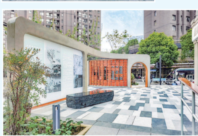
▲红色宝山路街区更新项目——“四·一二”惨案革命群众流血牺牲地点

史问迹 红色宝山”小程序，参观者每到一个站点，都可通过扫描二维码进行线上人文行走“打卡”，率先解锁红色遗址图片和简介，参观结束后还可查看“我的打卡点”，通过“点亮路线图”，生成自己的行走路线，并可一键转发到朋友圈，吸引更多一起探索红色宝山路。在线上与线下的结合中，将人文行走变成一种学习习惯，引导辖区广大党员群众通过深度参与去了解、去发现、去思考、去传承，不断扩大红色宝山路的归属感和影响力，为社区创新治理注入不竭动力。