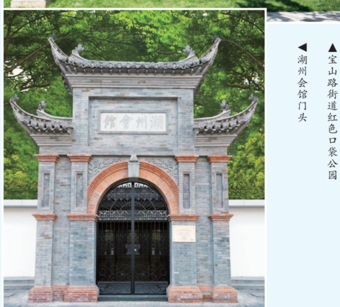
▲宝山路街道红色口袋公园 ▲湖州会馆门头