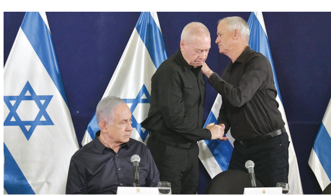
这张2023年11月18日的照片显示,以色列战时内阁出席一场在特拉维夫举行的新闻发布会。他们是以总理内塔尼亚胡、国防部长加兰特和反对党国家团结党领导人甘茨(从左至右)。

《以色列时报》报道说,战时内阁解散后,内塔尼亚胡、国防部长加兰特将与其他相关官员就作战问题进行小规模临时磋商并做出关键决定,此后相关决定需得到安全内阁的最终批准。